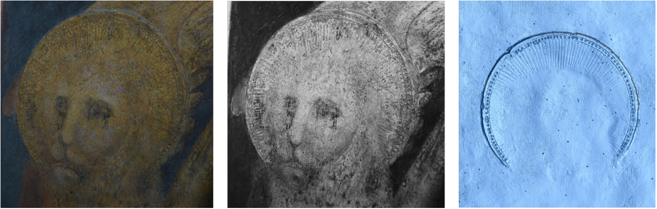
Immagine nel visibile, nell'infrarosso (IR 850 nm) e rilievo con scanner a luce strutturata in corrispondenza del leone presente nella parete est del Salone. Risultano chiaramente visibili sotto l'attuale superficie le tracce di un'aureola trecentesca su cui è stata impostata successivamente la testa del leone.