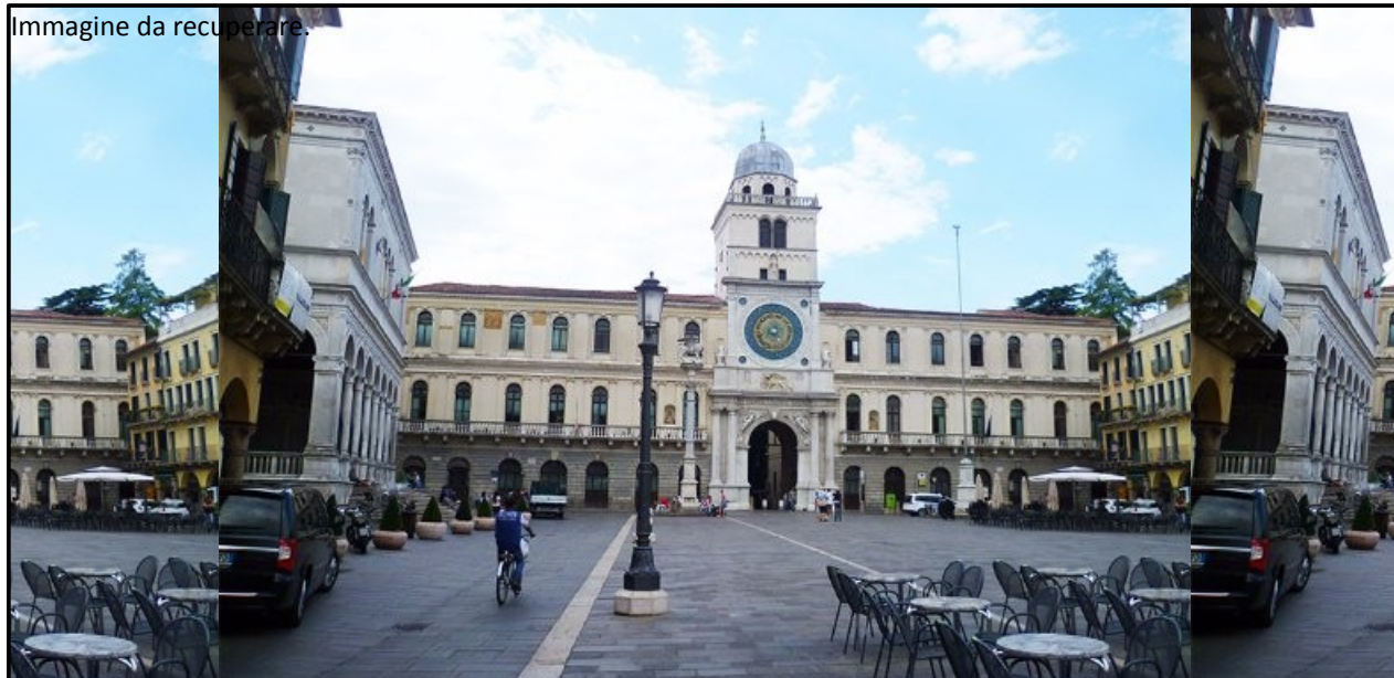
Immagine da recuperare.

Su entrambi i lati della torre dovranno essere disposti lungo i poggiali delle tende luminose ad alta resa e luminosità . Avranno un'altezza di 1,5 metri percorreranno tutta la lunghezza del poggiole per totale di 60 metri (30metri per lato).