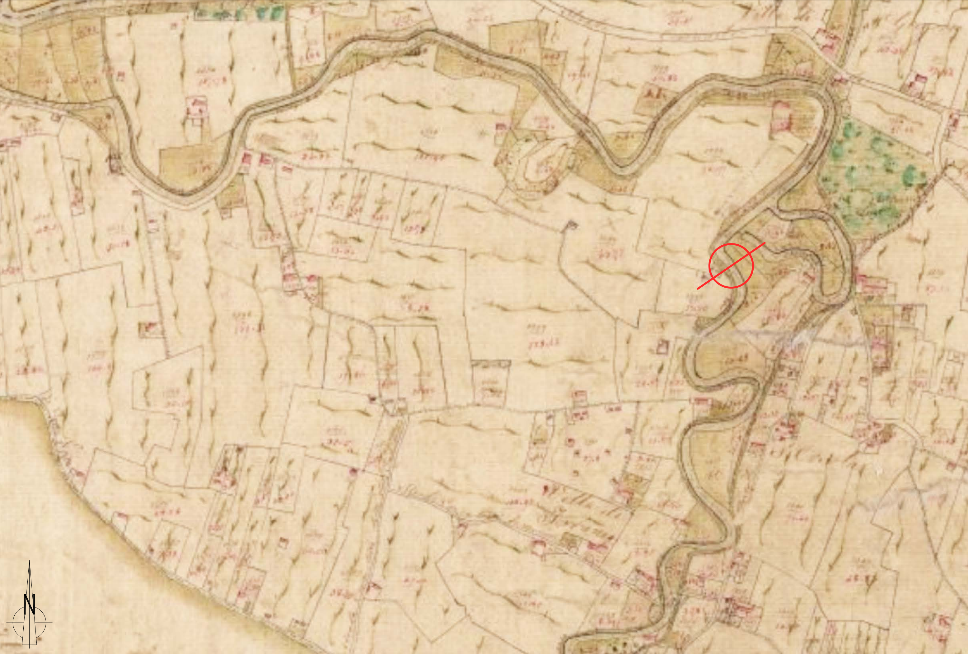
Quadro d'unione Catasto Napoleonico 1811