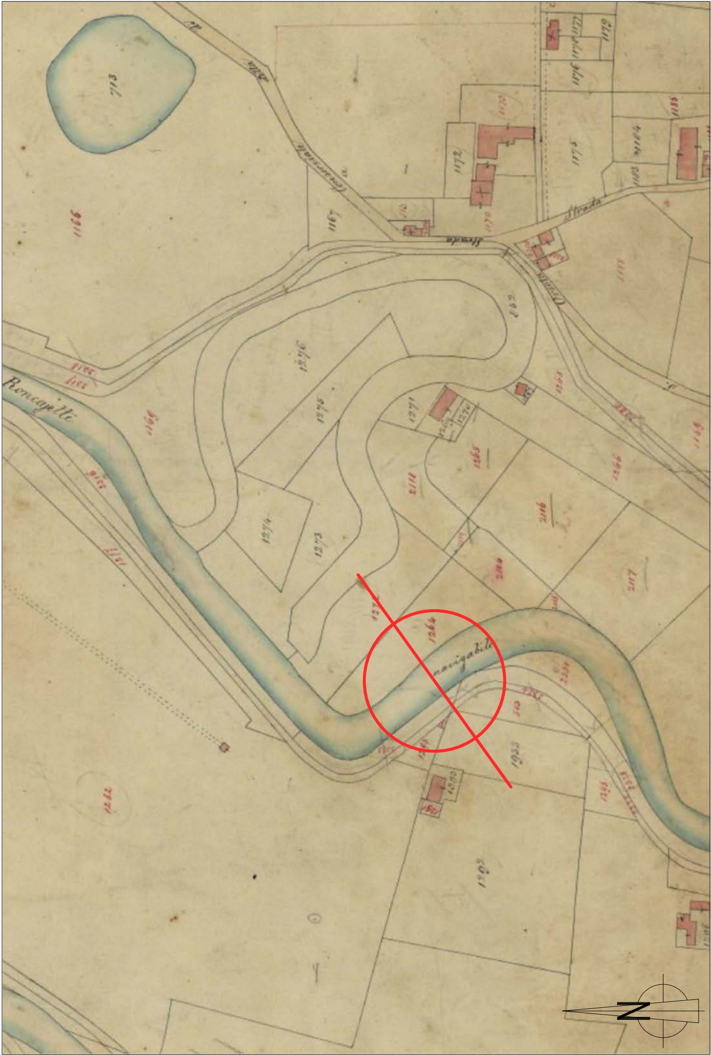
Catasto Austriaco Italiano Aggiornato 1852