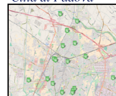
Città di Padova