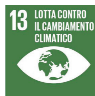
LOTTA CONTRO IL CAMBIAMENTO CLIMATICO