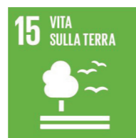
VITA SULLA TERRA