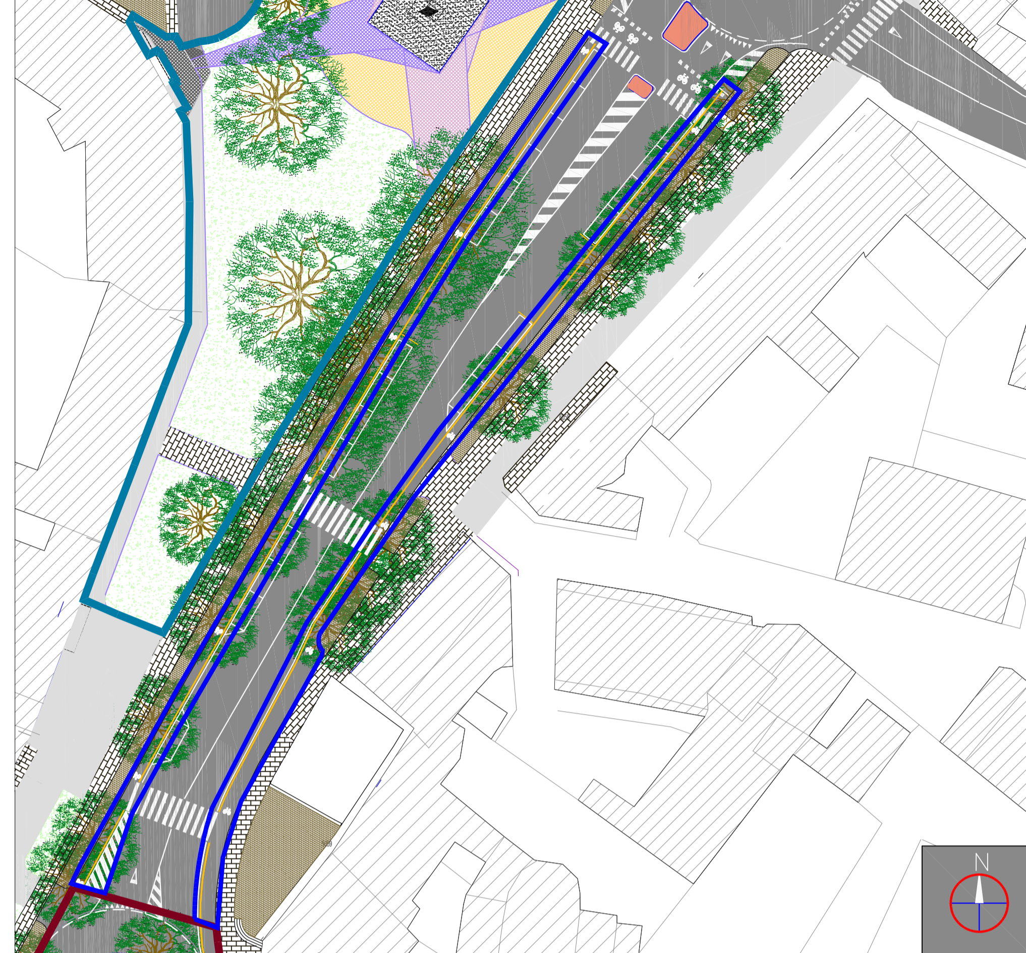
Ambito 4 (blu) FRI – UNIPS – Comune di Padova – Scala 1:1.000