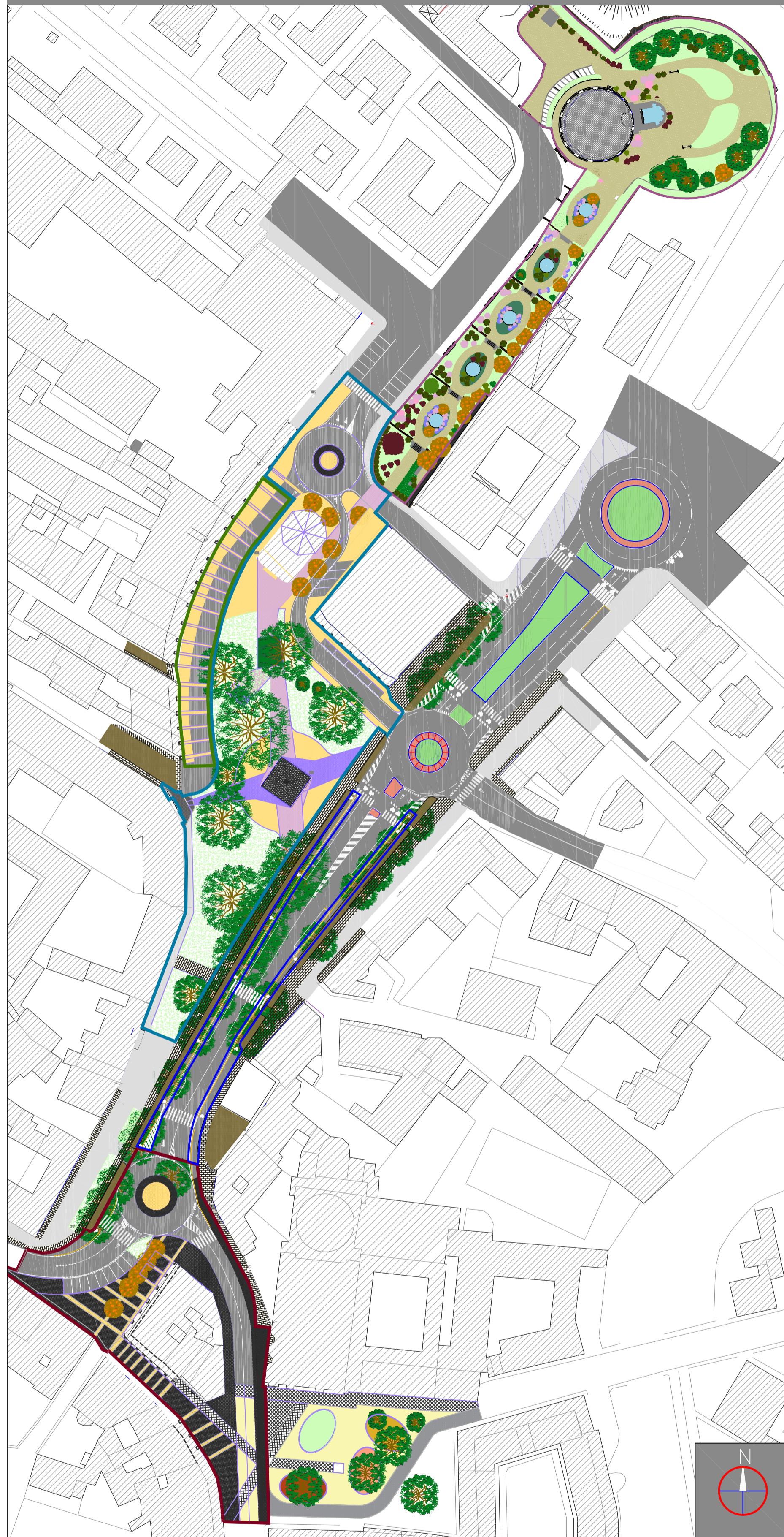
Planimetria d'unione con tutti gli ambiti – Scala 1:1.000