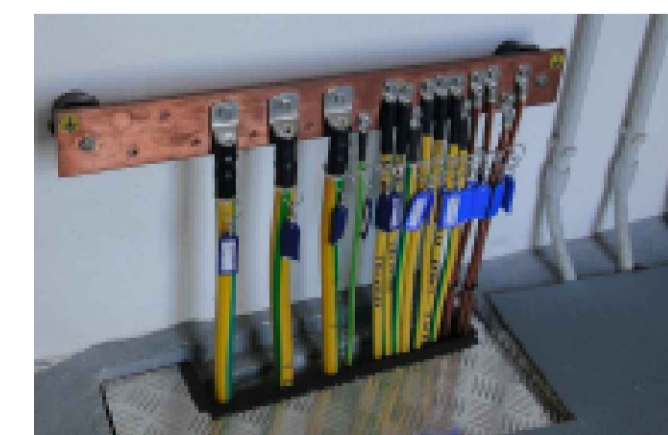
COLLETTORE DI TERRA CON CAVI ETICHETTATI PER COMODA IDENTIFICAZIONE.