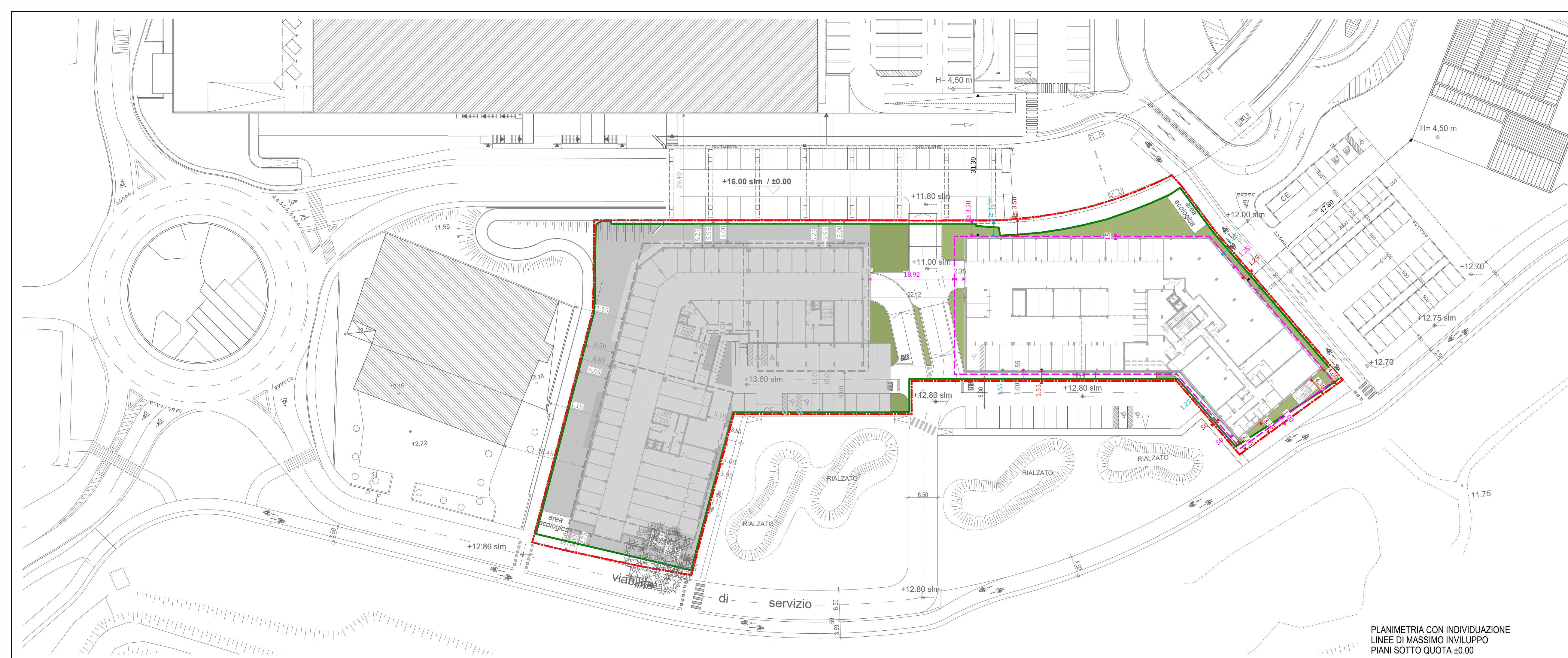
PLANIMETRIA CON INDIVIDUAZIONE LINEE DI MASSIMO INVILUPPO PIANI SOTTO QUOTA ±0.00