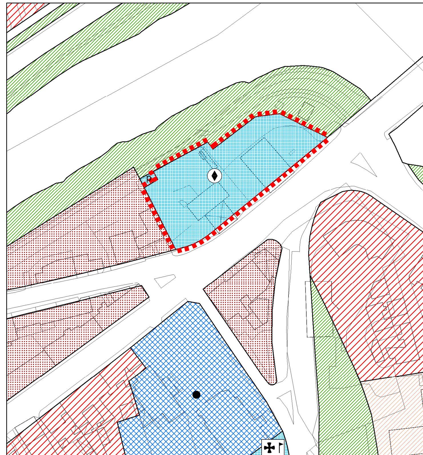
P.I. MODIFICA stralcio