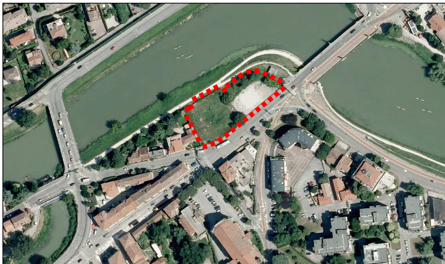
Stralcio di ORTOFOTO