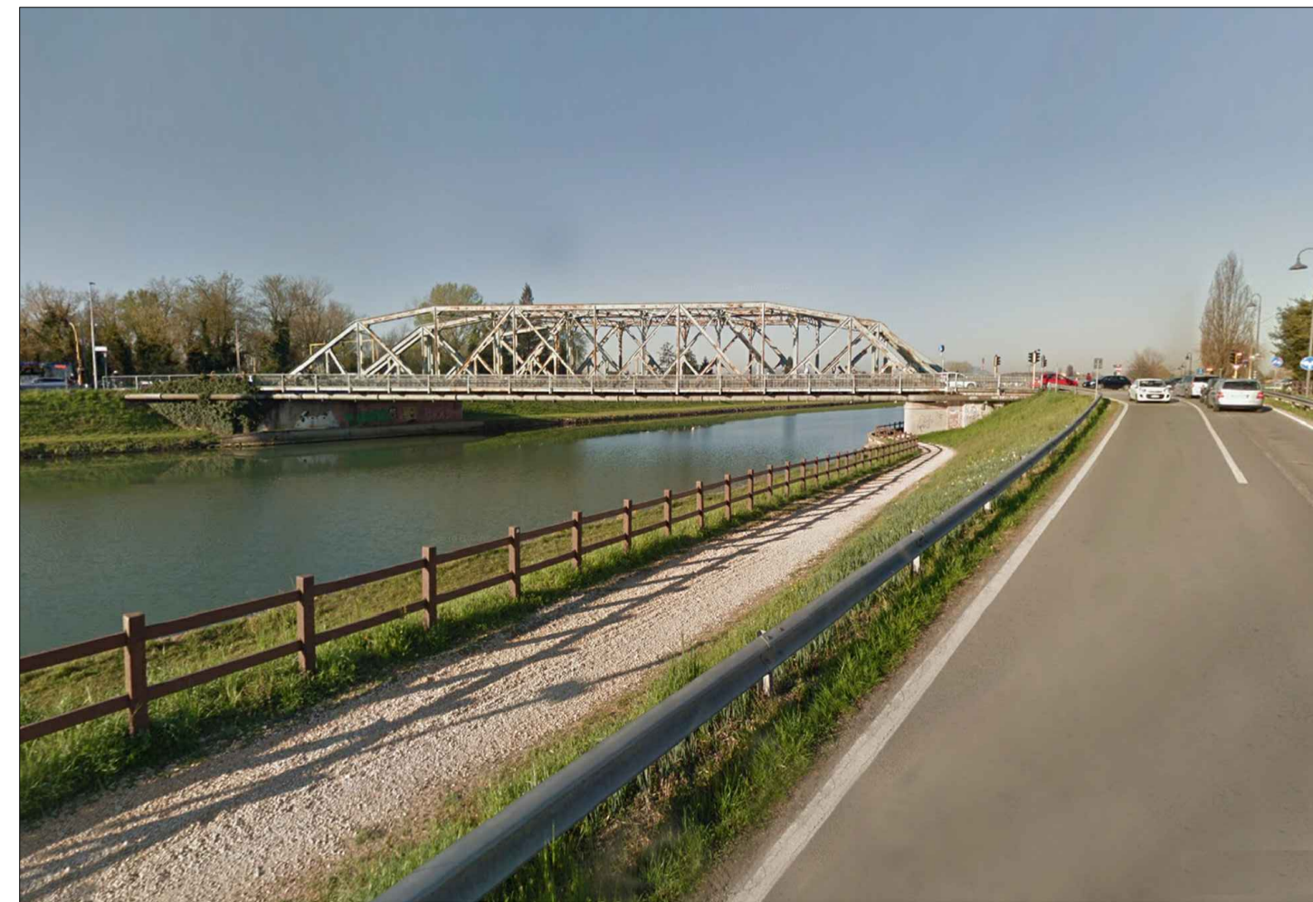
FOTO 7_DA LUNGARINE TERRANEGRA VERSO NUOVO PONTE CANALE SCARICATORE