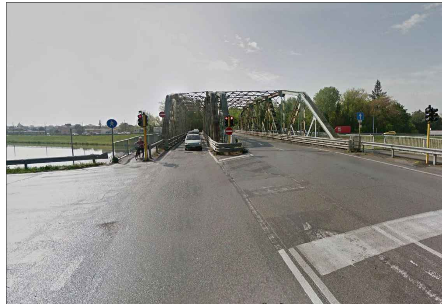
FOTO 8_DA VIA JACOPO FACCIOLATI VERSO NUOVO PONTE CANALE SCARICATORE