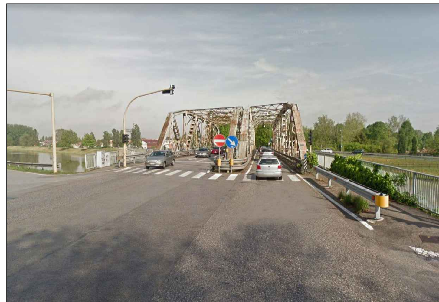
FOTO 5_DA VIA PIOVESE VERSO NUOVO PONTE CANALE SCARICATORE