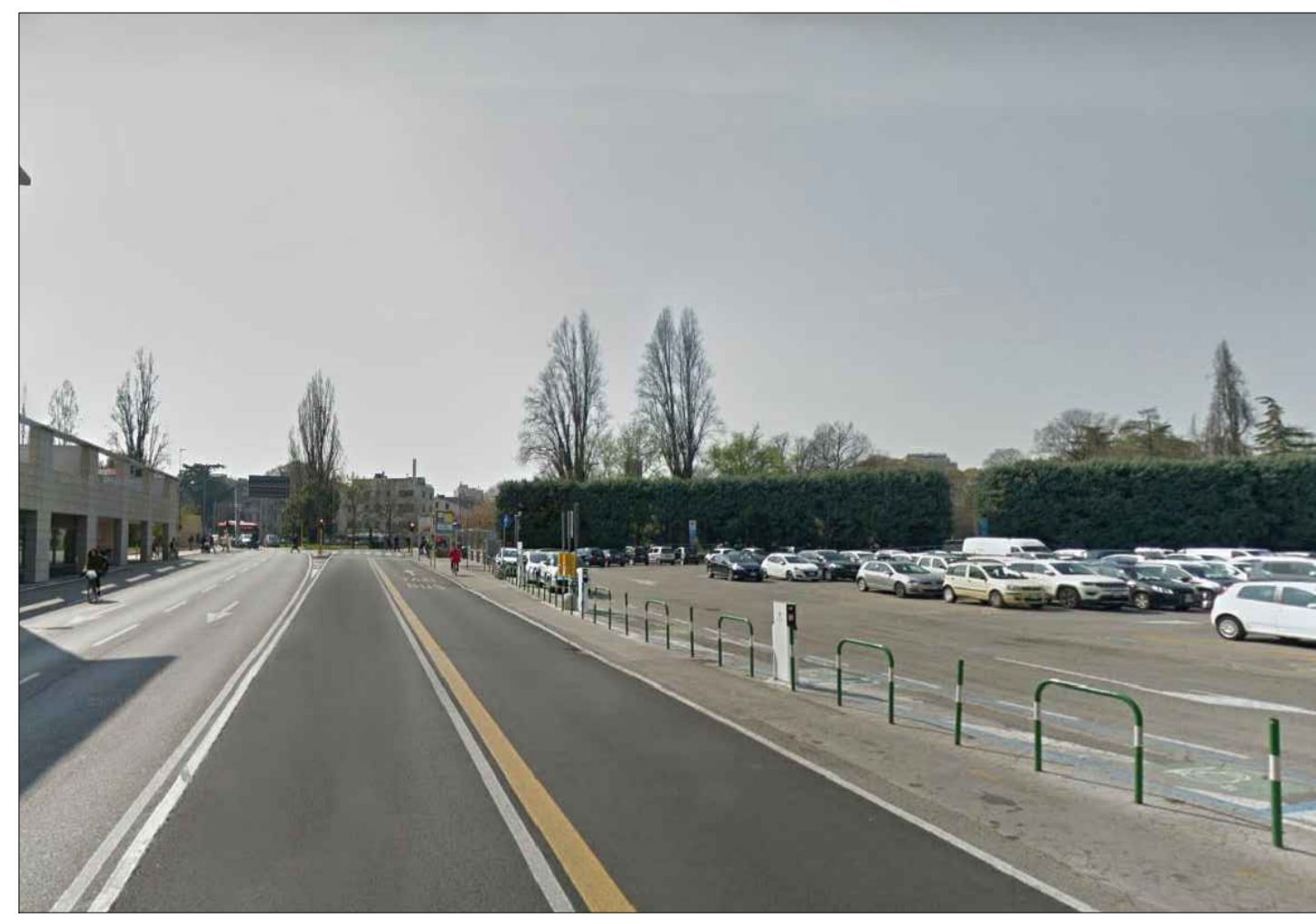
FOTO 2_ VIA GASPARE GOZZI