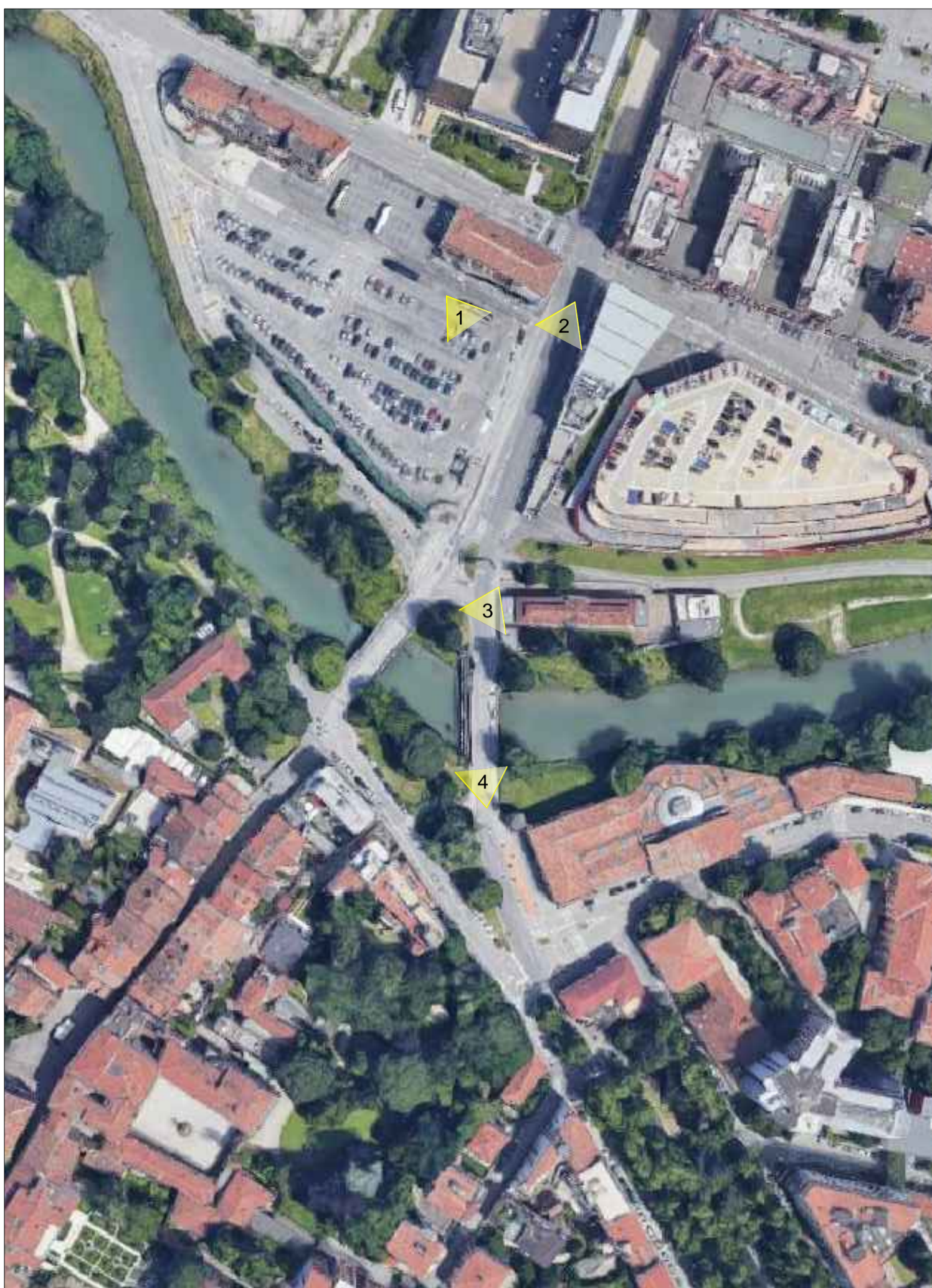
PLANIMETRIA VIA GASPARE GOZZI E PONTE OMIZZOLO