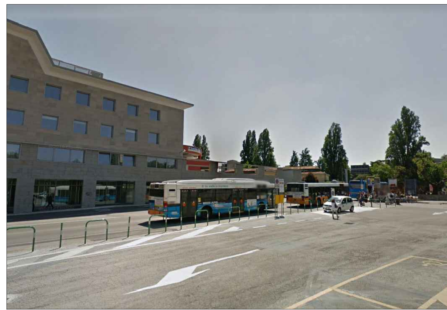
FOTO 1_DAL PARCHEGGIO PIAZZALE BOSCHETTI VERSO VIA GASPARE GOZZI