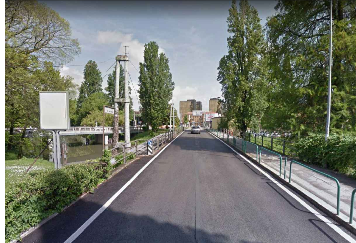
FOTO 4_ PONTE OMIZZOLO