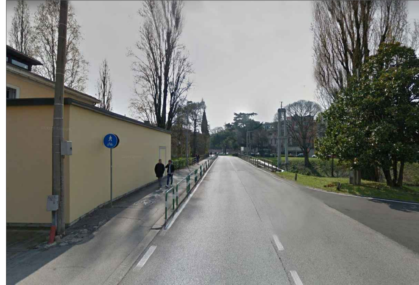
FOTO 3_DA VIA GASPARE GOZZI VERSO PONTE OMIZZOLO