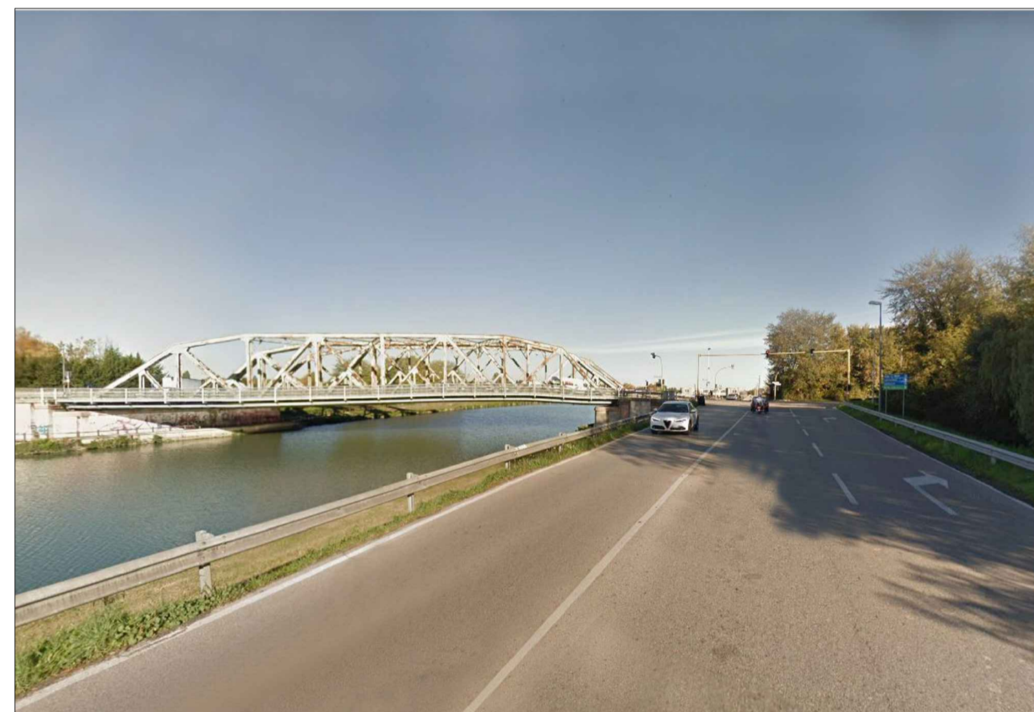
FOTO 7_DA LUNGARINE SEBASTIANO ZIANI VERSO NUOVO PONTE CANALE SCARICATORE