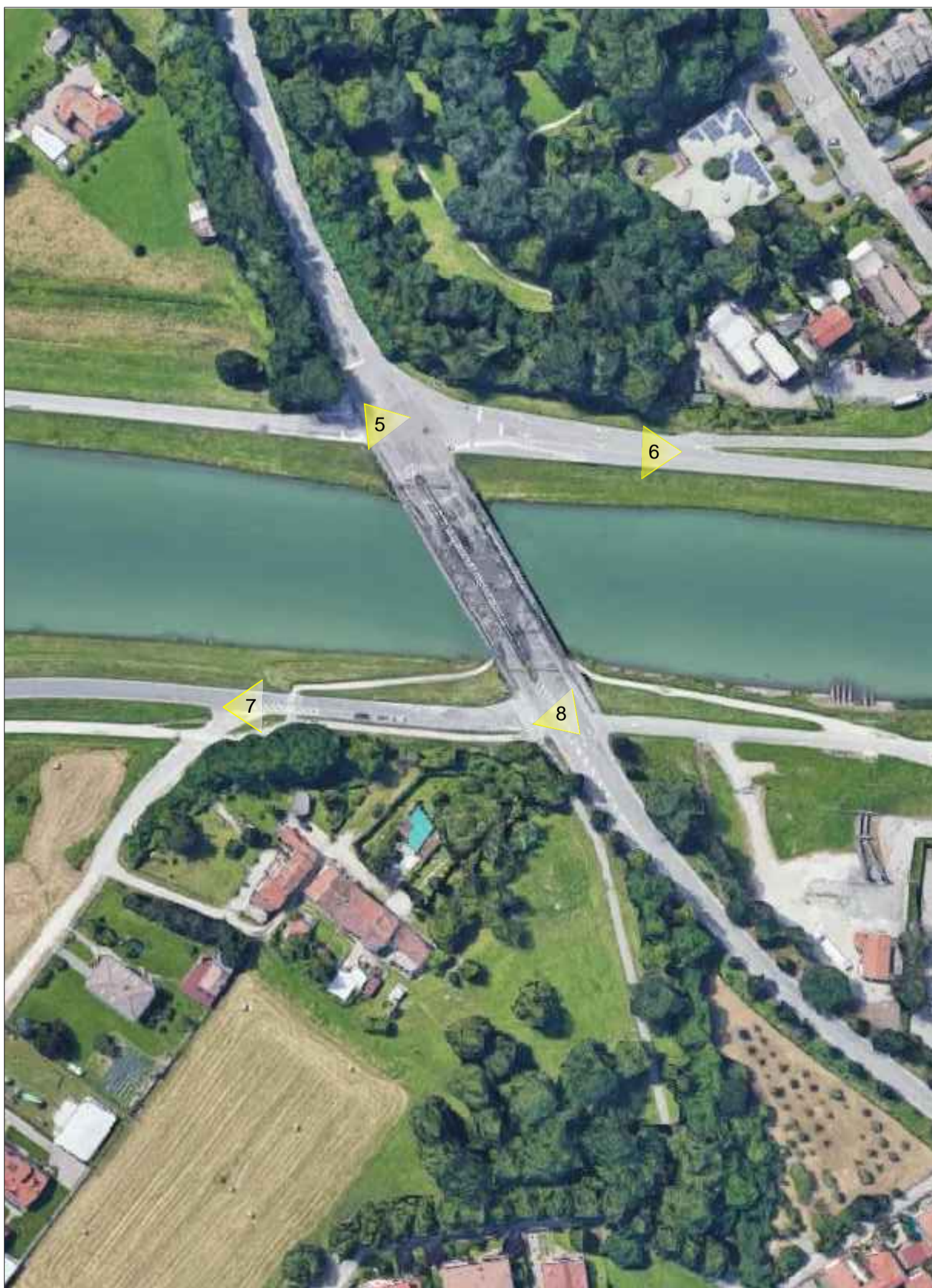
PLANIMETRIA NUOVO PONTE SU CANALE SCARICATORE