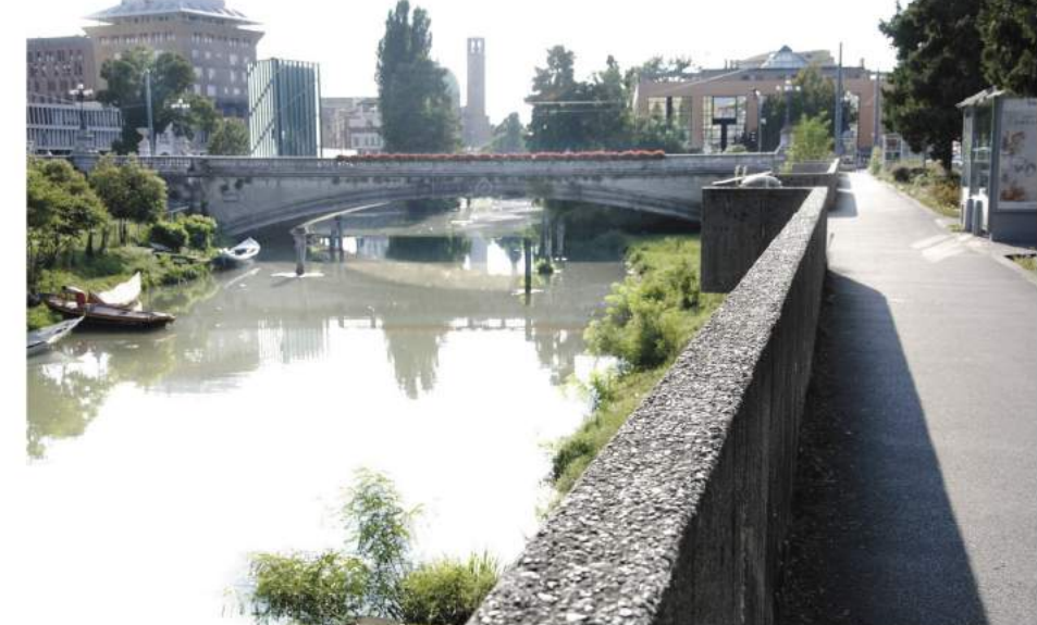
Anni '50 Ponte di Corso del Popolo, vista dalla galera delle Porto Colaninno, oggi sede del monumento ai caduti dell'11 settembre 2001