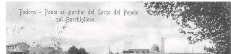
Padova - Ponte ai giardini del Corso del Popolo di Archivio

Comune di Padova - Settore Lavori Pubblici via N. Tommaseo, 60 - 35131 Padova, telefono segreteria: t. +39 049 8204394 - f. +39 049 8204332 enti@comune.padova.it Ufficio progettazione ed esecuzione interventi Responsabile Unico del Procedimento: Arch. Stefano Berneviggi Progettista Architettonico Lorenzo Atolico Via Piave, 8 - 35138 - Padova - t. +39 049 0973381 - f. +39 049 0973380 Progettista Strutturale Parco Studio Navarria Associati Via Cristoforo Colombo, n. 20 - Selvazzano Dentro 35030 PD - t. +39 049 8687122 Progettista Strutturale Palazzine SMA Ingegneria s.r.l. Via dell'Angeliante, n. 7 - Caselle di Sommacampagna, 37066 VR - t. +39 045 8581111 - f. +39 045 8589182