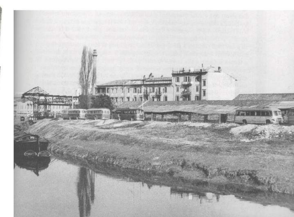
Anni '50 Attacco sul Piovego dell'area Boschetti, vista lungo il fianco sx del Piovego, verso Corso del Popolo.