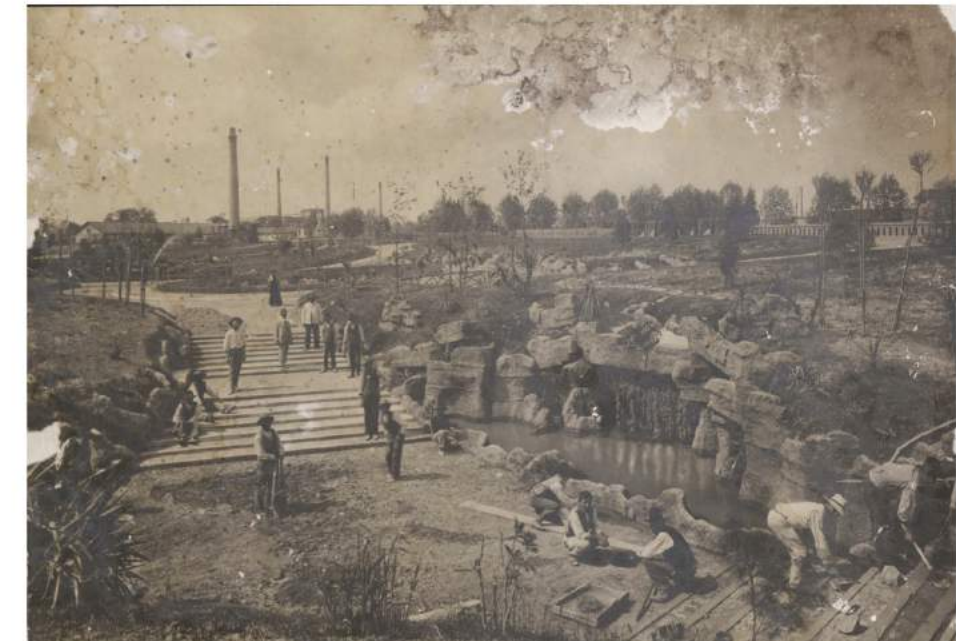
Primi anni del '900 Giardini dell'Arena Romana, vista lungo il fianco dell'asse principale, verso Corso del Popolo.