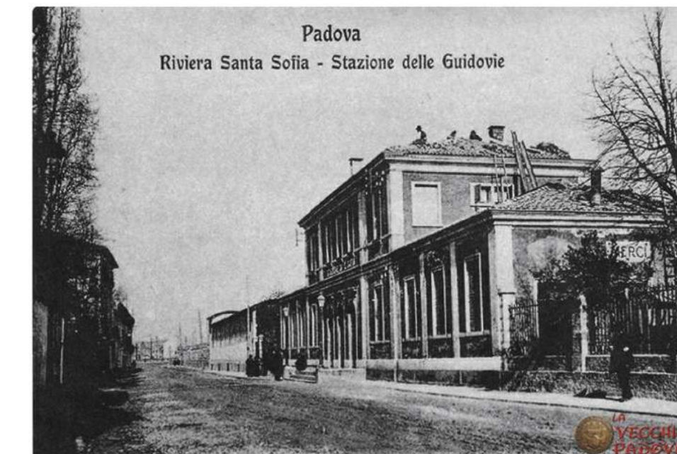
Padova Riviera Santa Sofia - Stazione delle Guidone