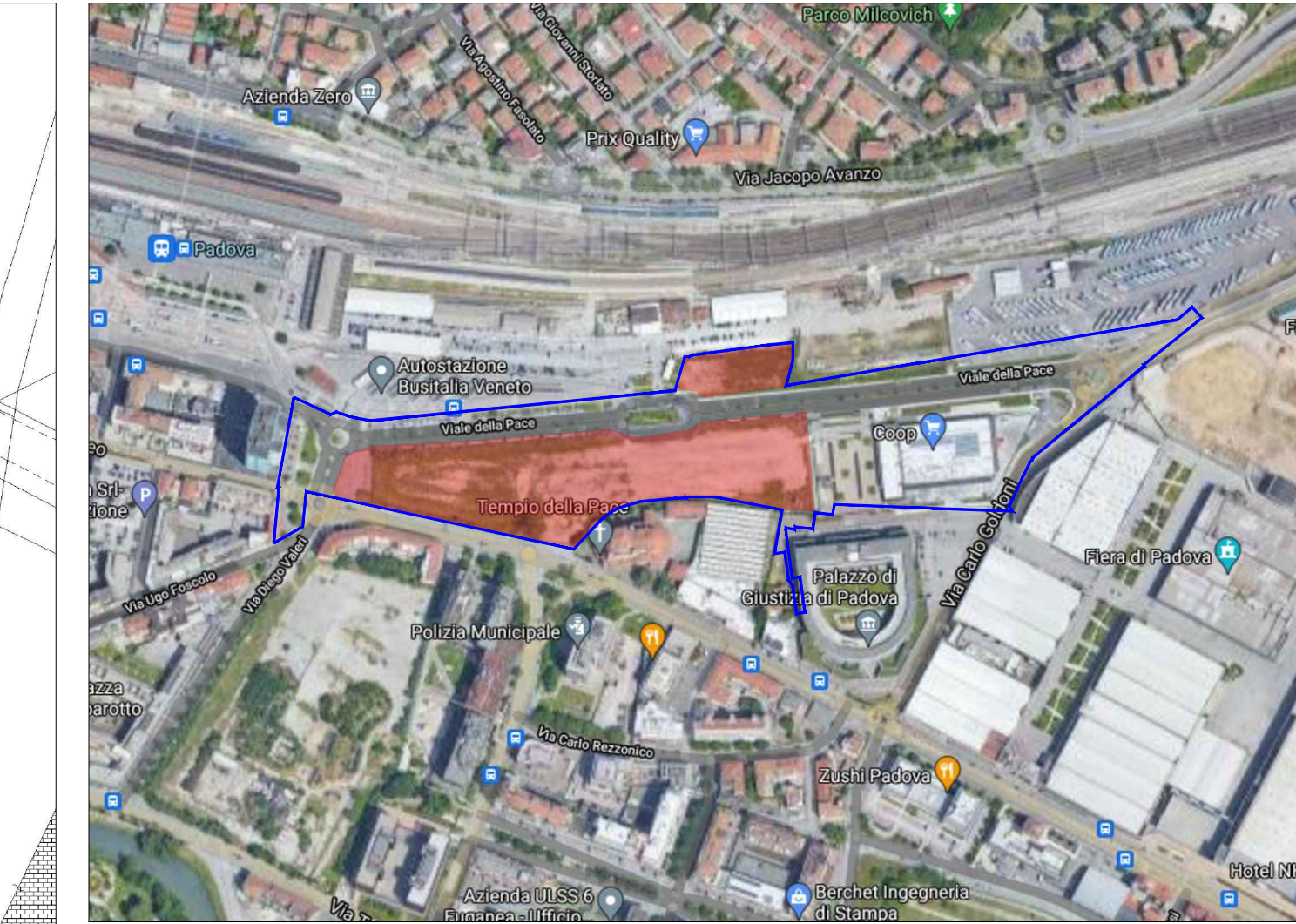
PIANO DEGLI INTERVENTI VIGENTE - Scala 1:5000