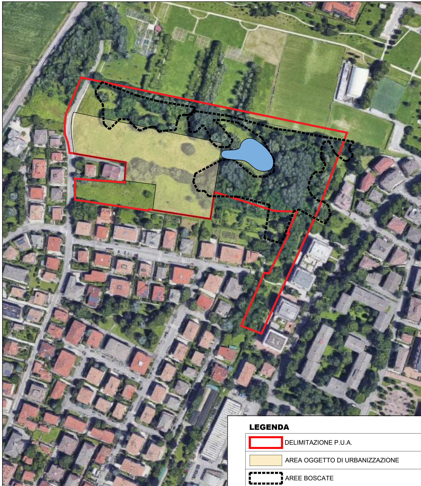
SOVRAPPOSIZIONE AREA URBANIZZATA ED AREE BOSCADE SCALA 1:2000