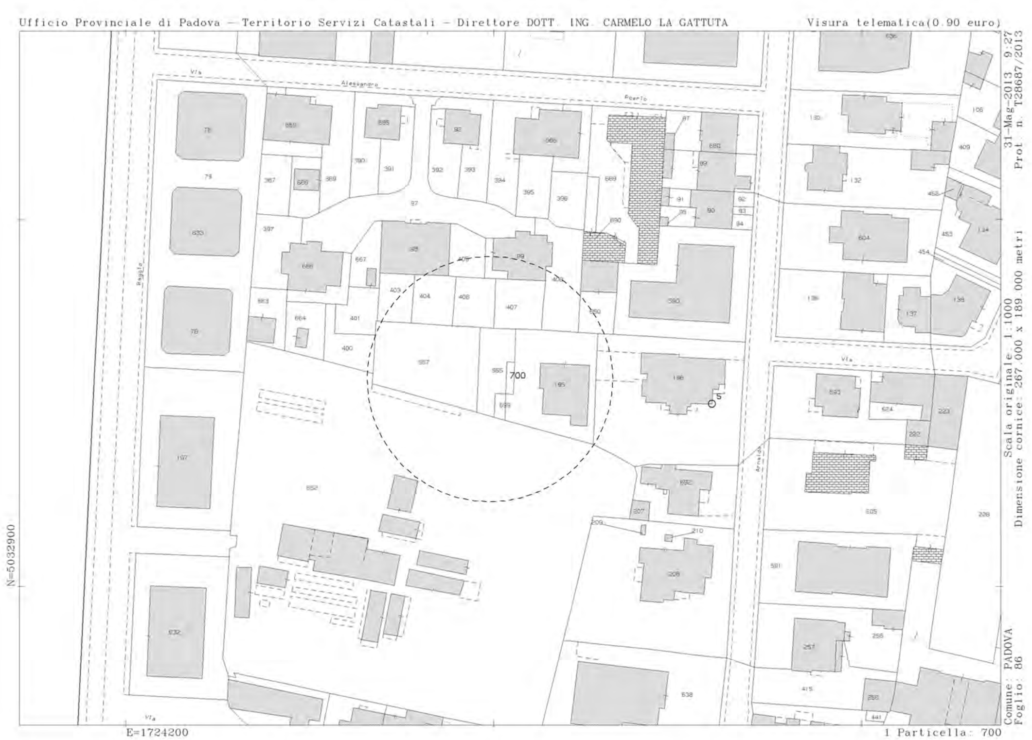
ESTRATTO DI MAPPA N.C.T. aggiornato