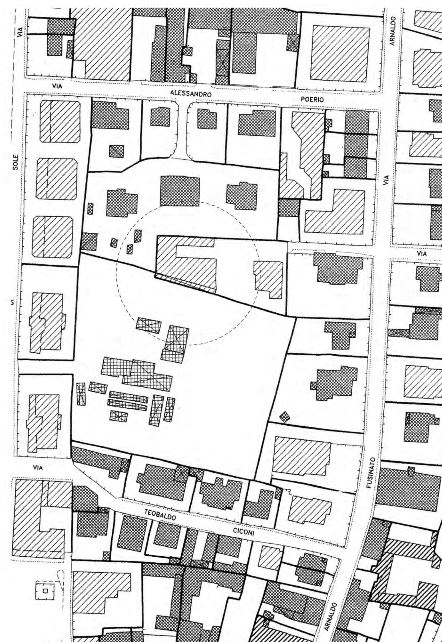
PRG CENTRO STORICO TAV. B1