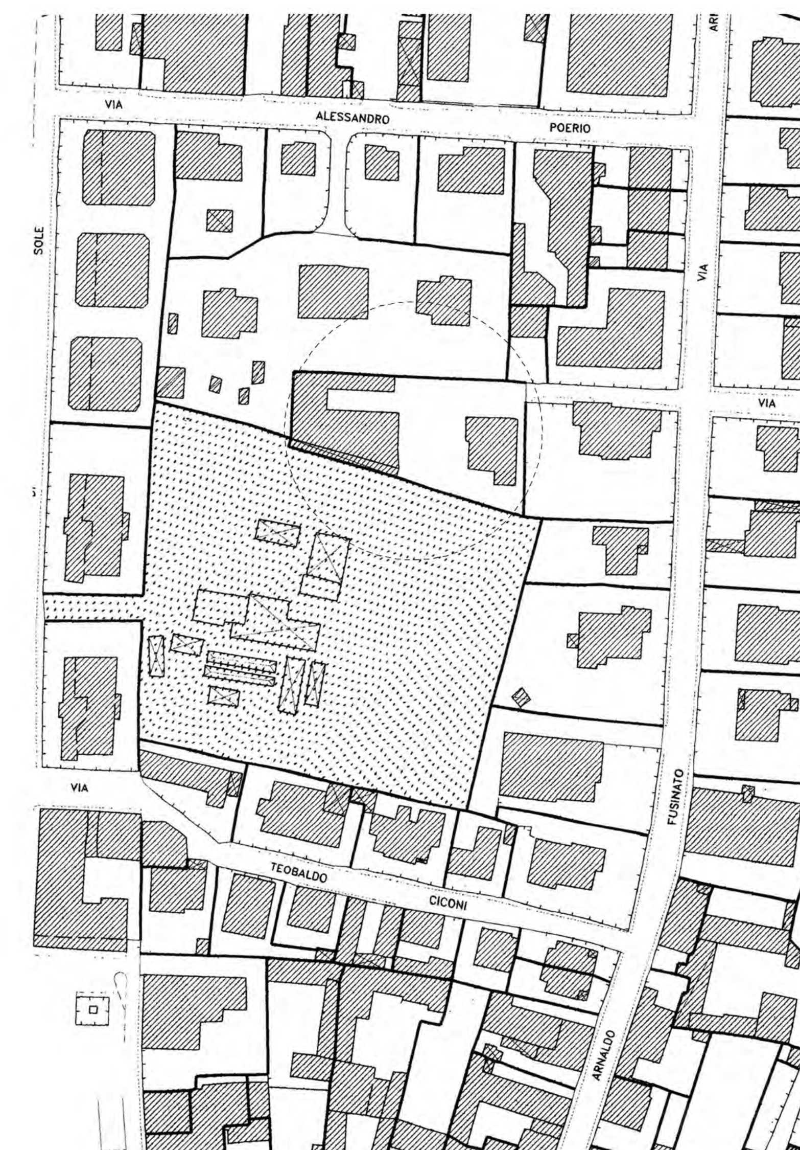
PRG CENTRO STORICO TAV. B2