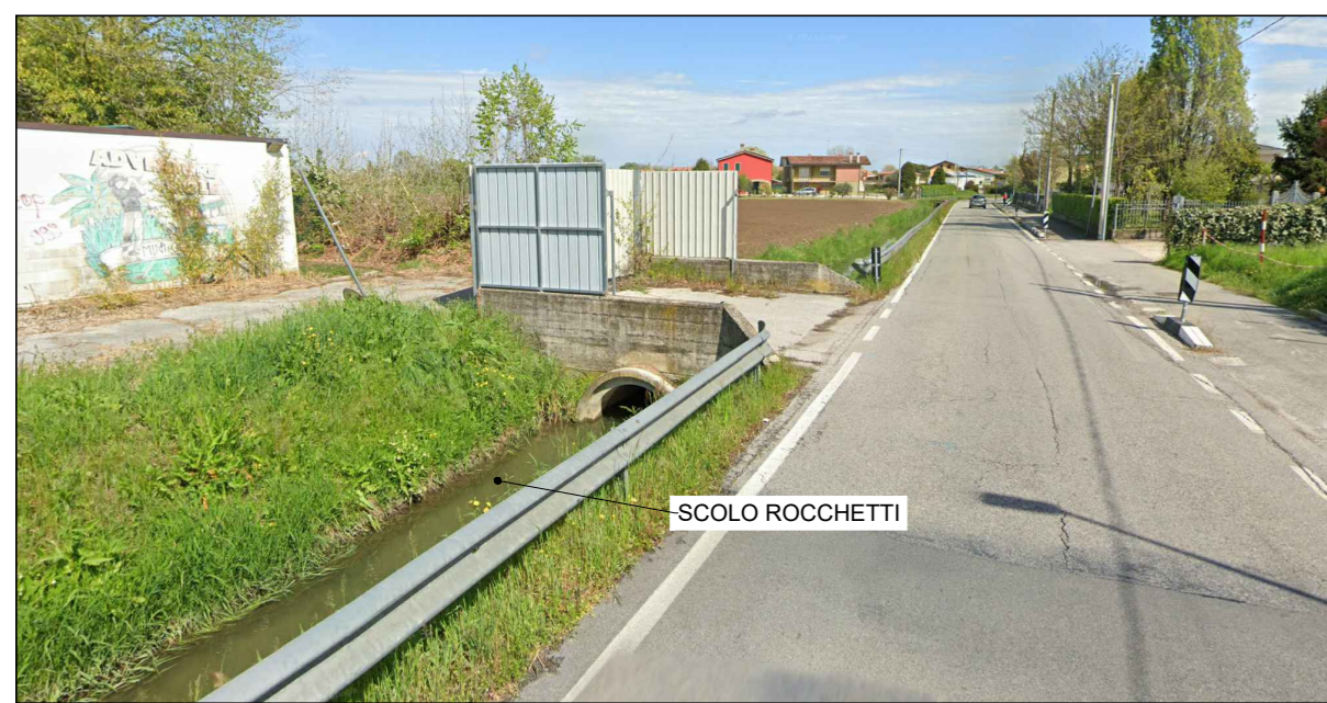
FOTO 2 - VISTA VERSO NORD SU LOTTO IN TRASFORMAZIONE