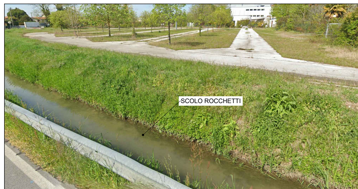
FOTO 3 - VISTA SU PASSO CARRAIO LATO OVEST