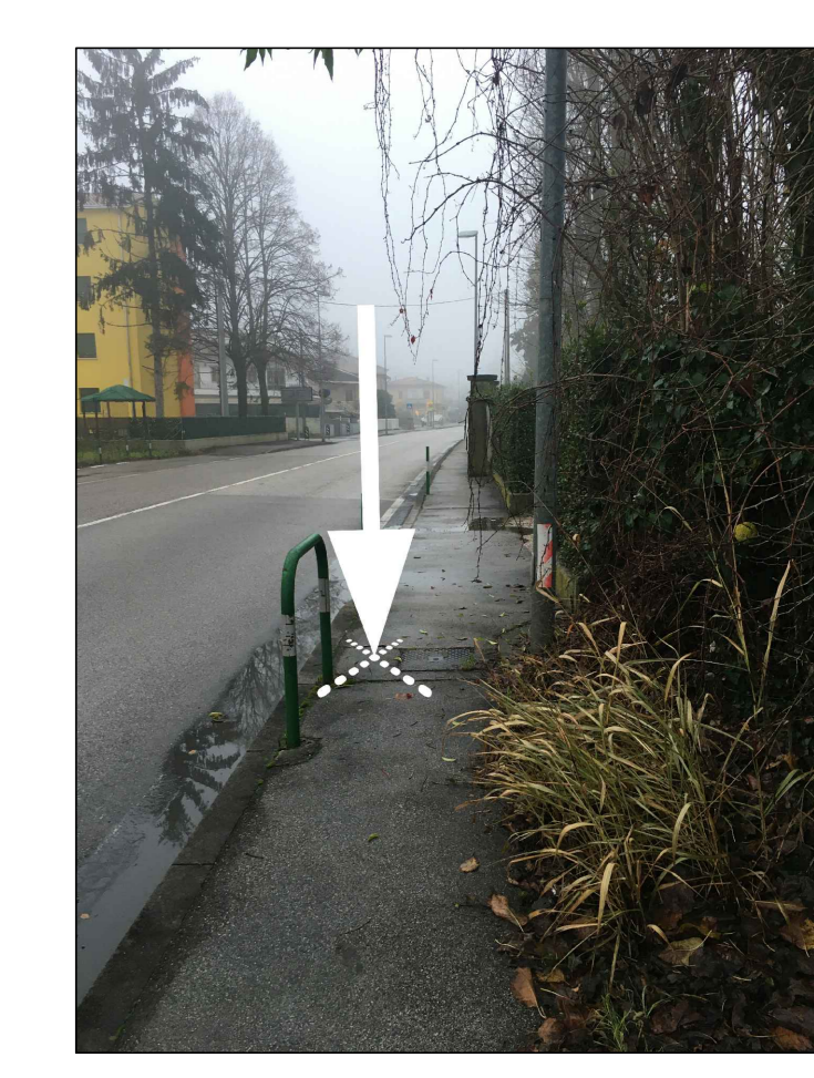
IDENTIFICAZIONE DEL PUNTO DI RIFERIMENTO PER LA QUOTA URBANISTICA 0.00