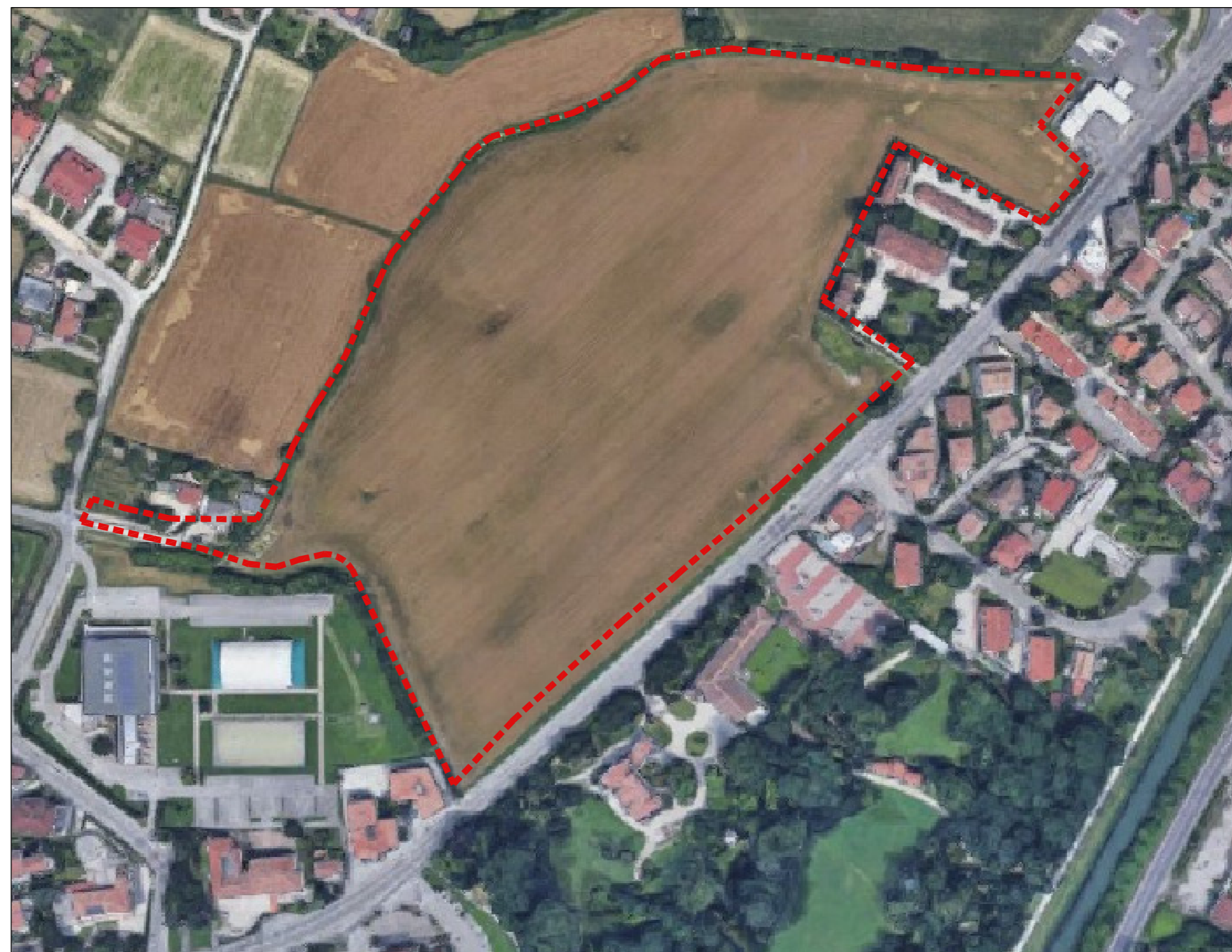
FOTOPIANO SCALA 1:2000