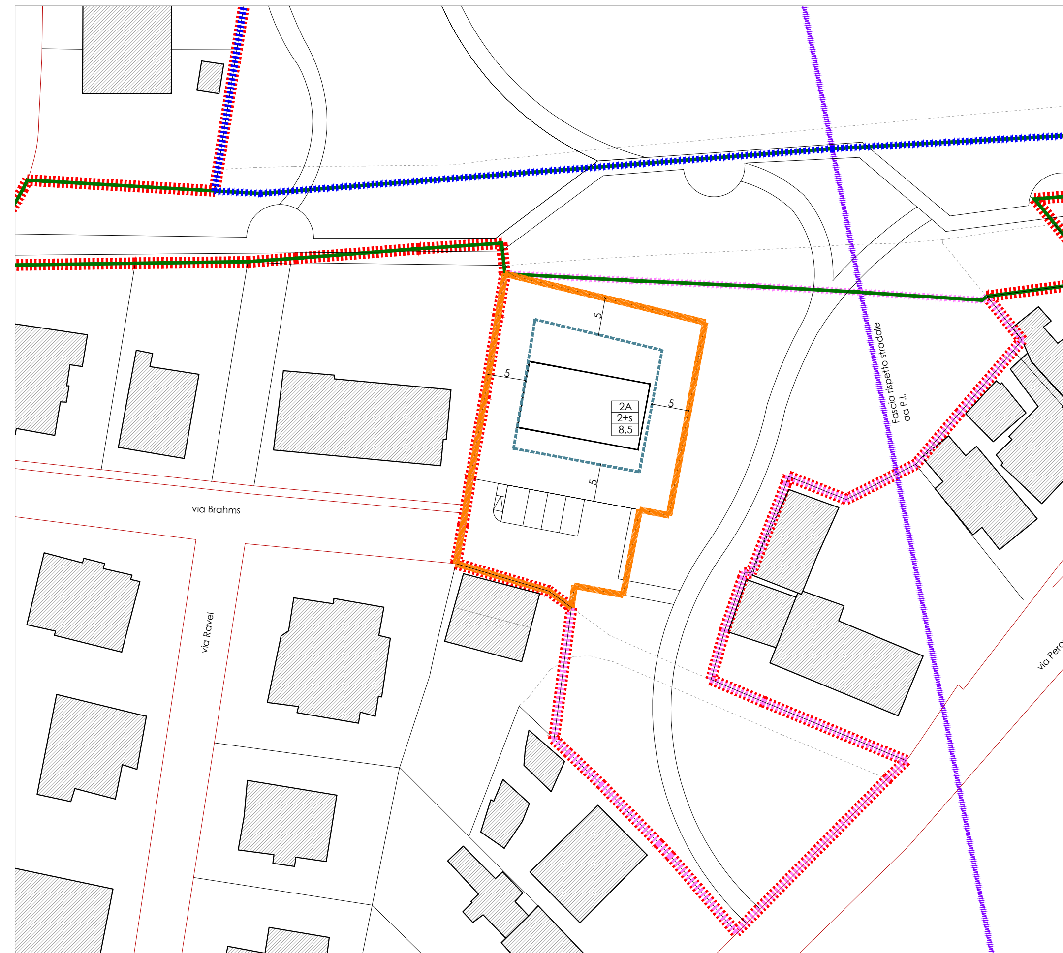
PARAMETRI EDILIZI APPROVATI

N — NUMERO LOTTO n — NUMERO MASSIMO DI PIANI CON EVENTUALE POSSIBILITA' SOTTOTETTO hm — ALTEZZA MASSIMA EDIFICIO