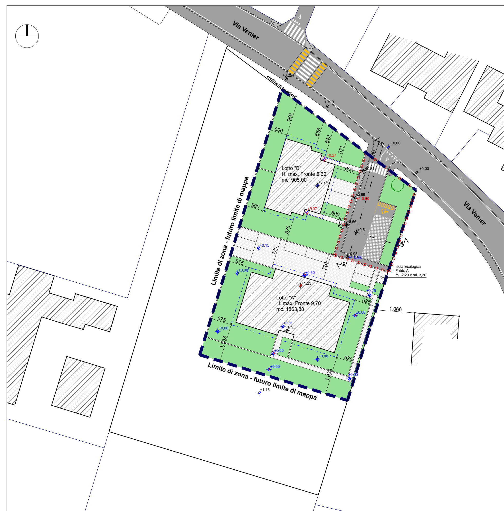
Planivolumetrico scala 1:500