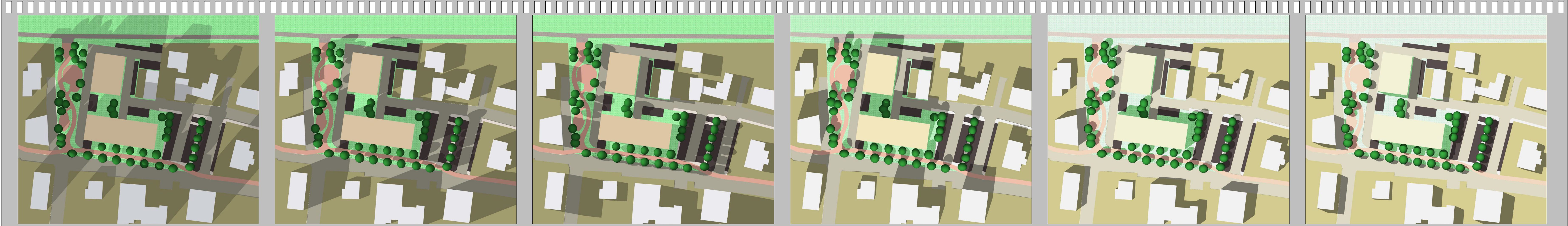
FINE GENNAIO ORE 10 FINE GENNAIO ORE 12 FINE GENNAIO ORE 14 FINE LUGLIO ORE 10 FINE LUGLIO ORE 12 FINE LUGLIO ORE 14