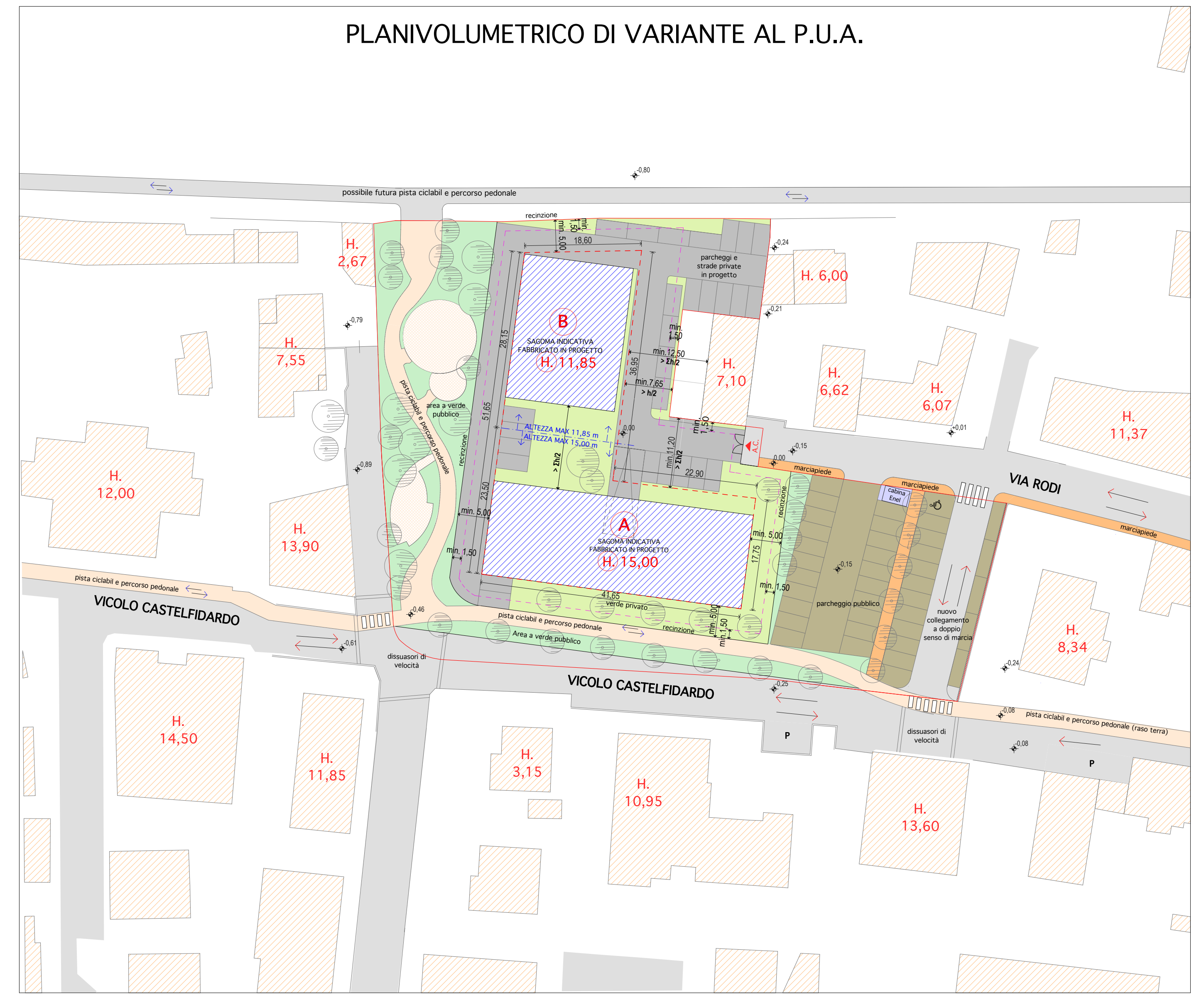
PLANIVOLUMETRICO DI VARIANTE AL P.U.A. SC. 1:500