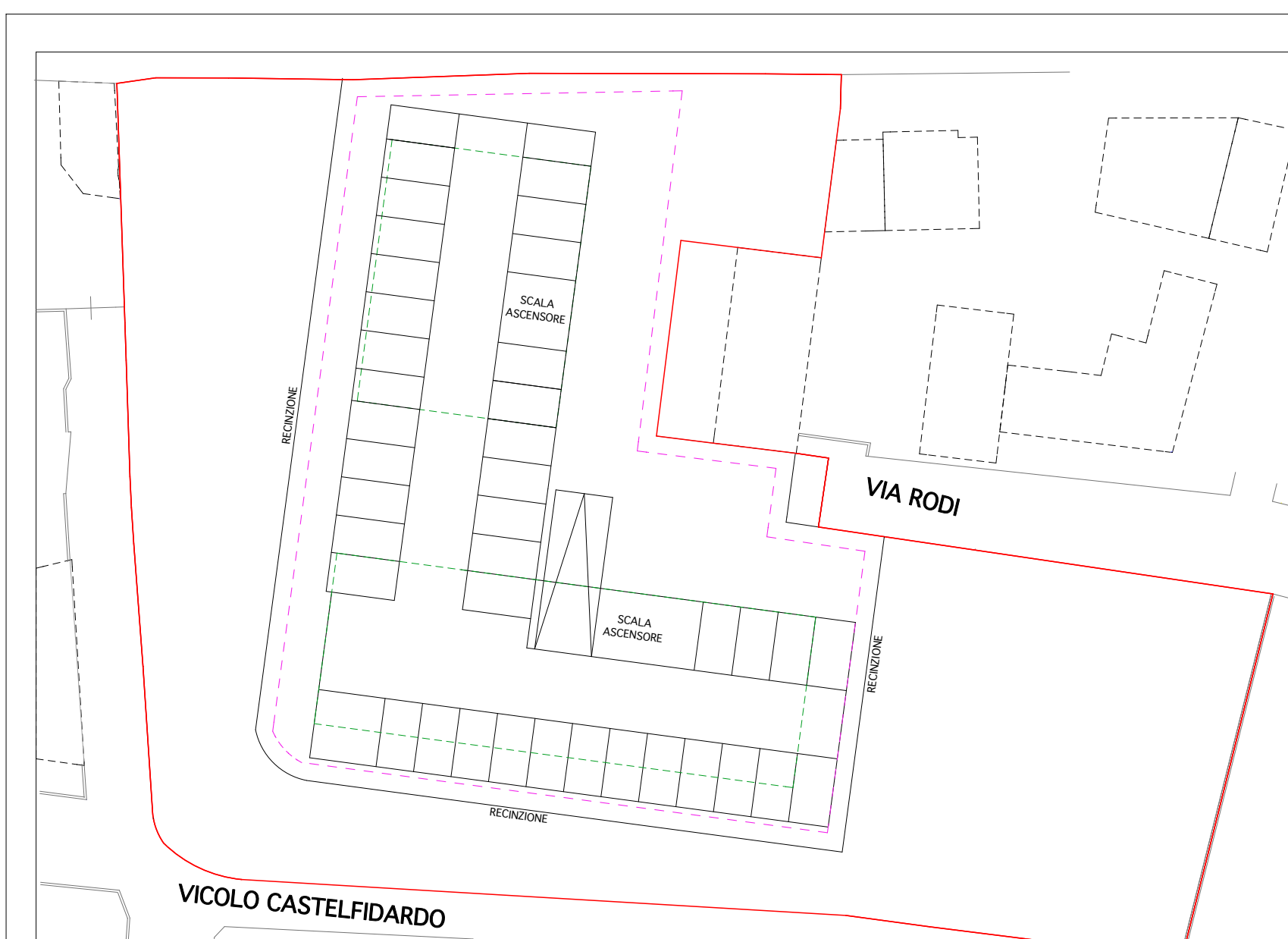
SCHEMA INDICATIVO DEL PIANO INTERRATO - INVARIATO SC. 1:500