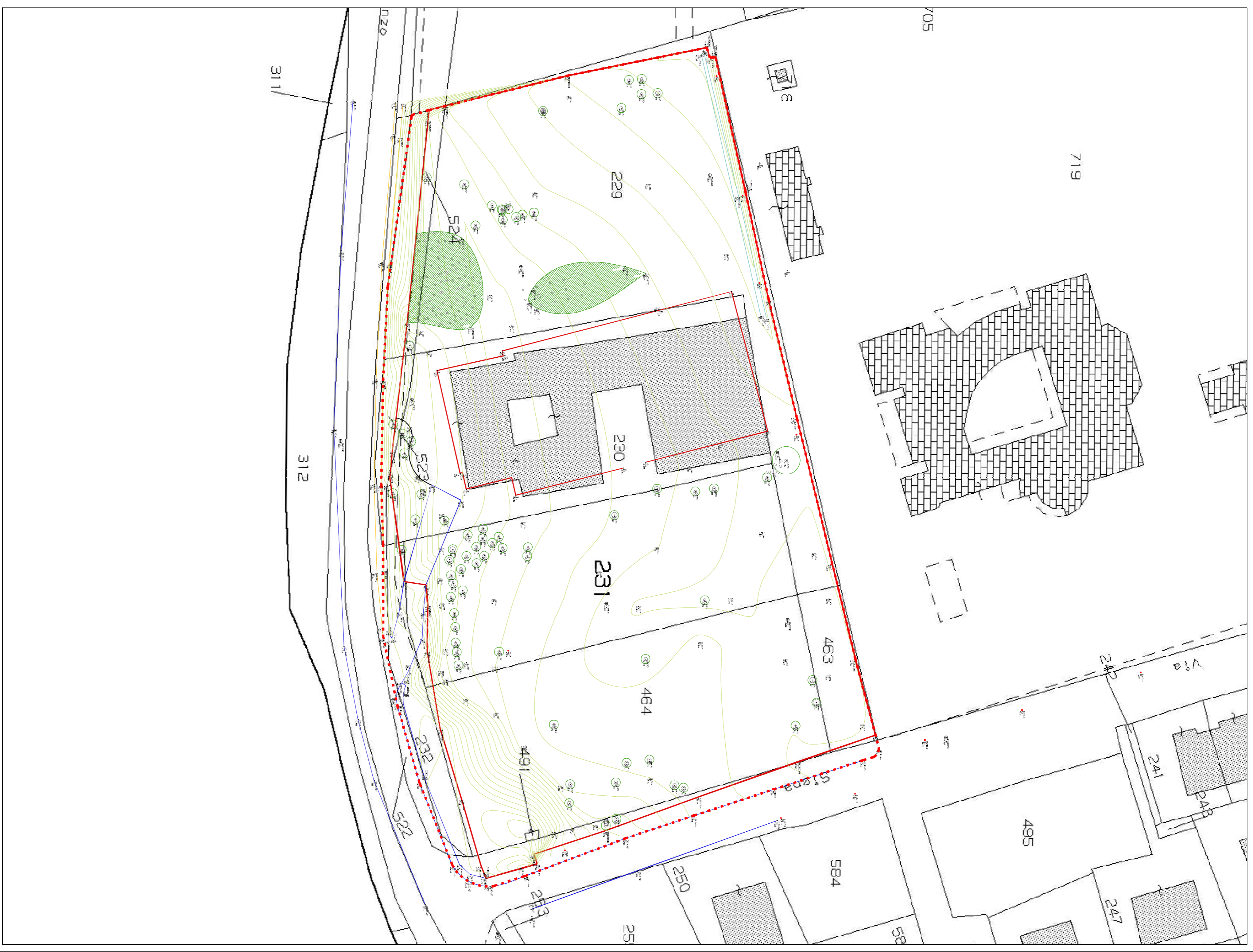
SOVRAPPOSIZIONE P.R.G. E RILIEVO