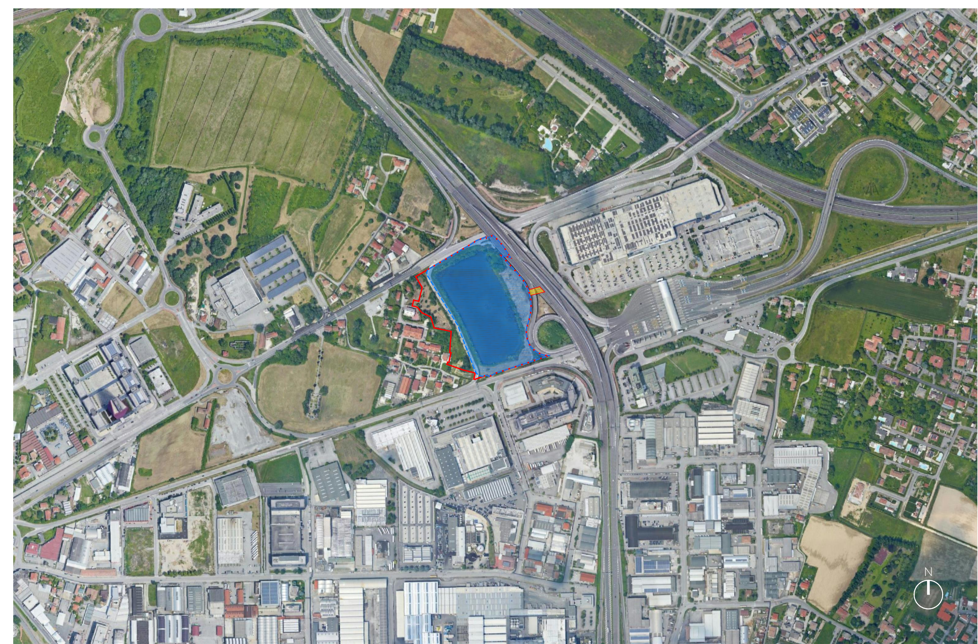
Individuazione ambito su ortofotopiano - Scala 1:5.000