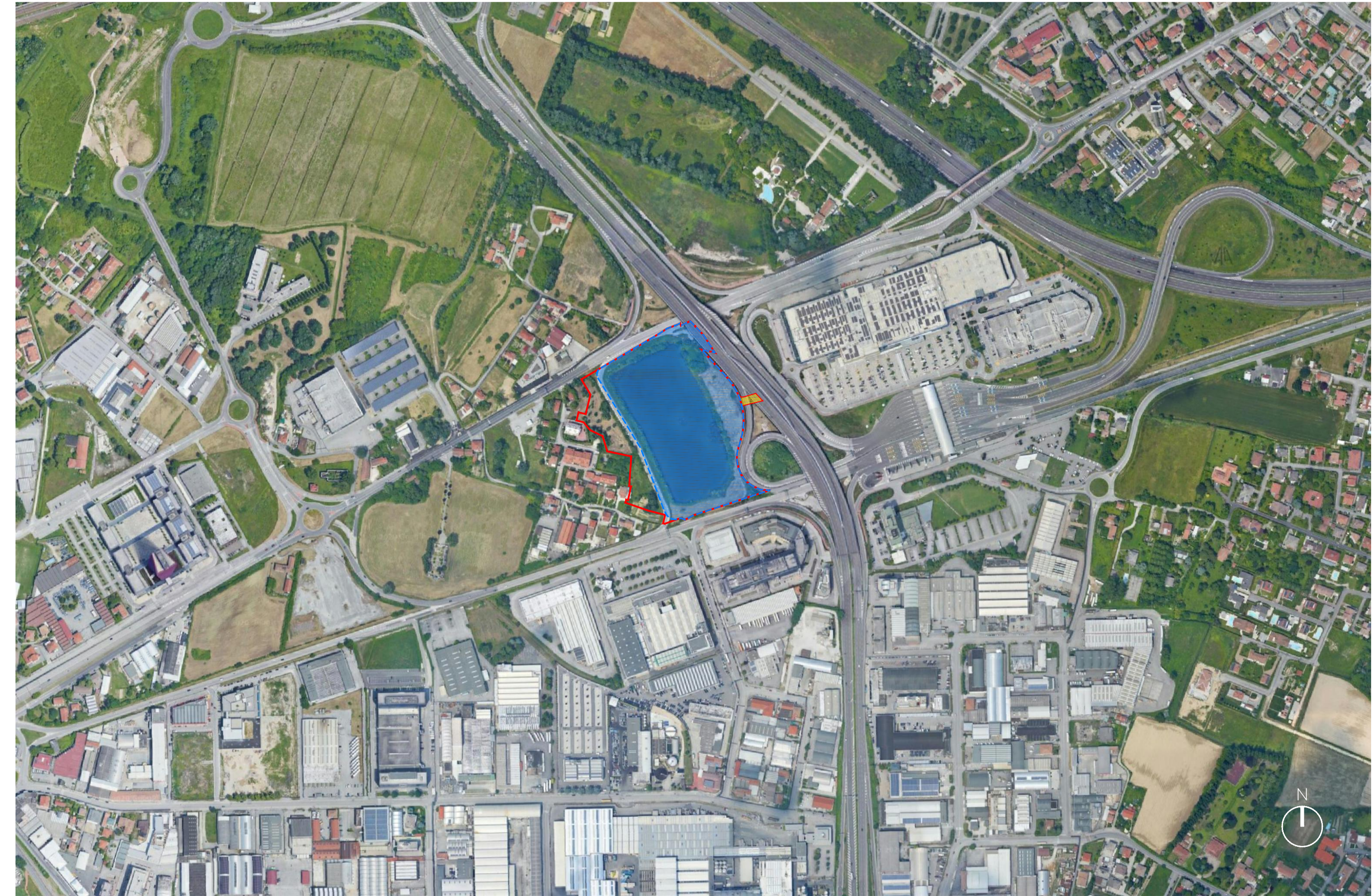
Individuazione ambito su ortofotopiano - Scala 1:5.000