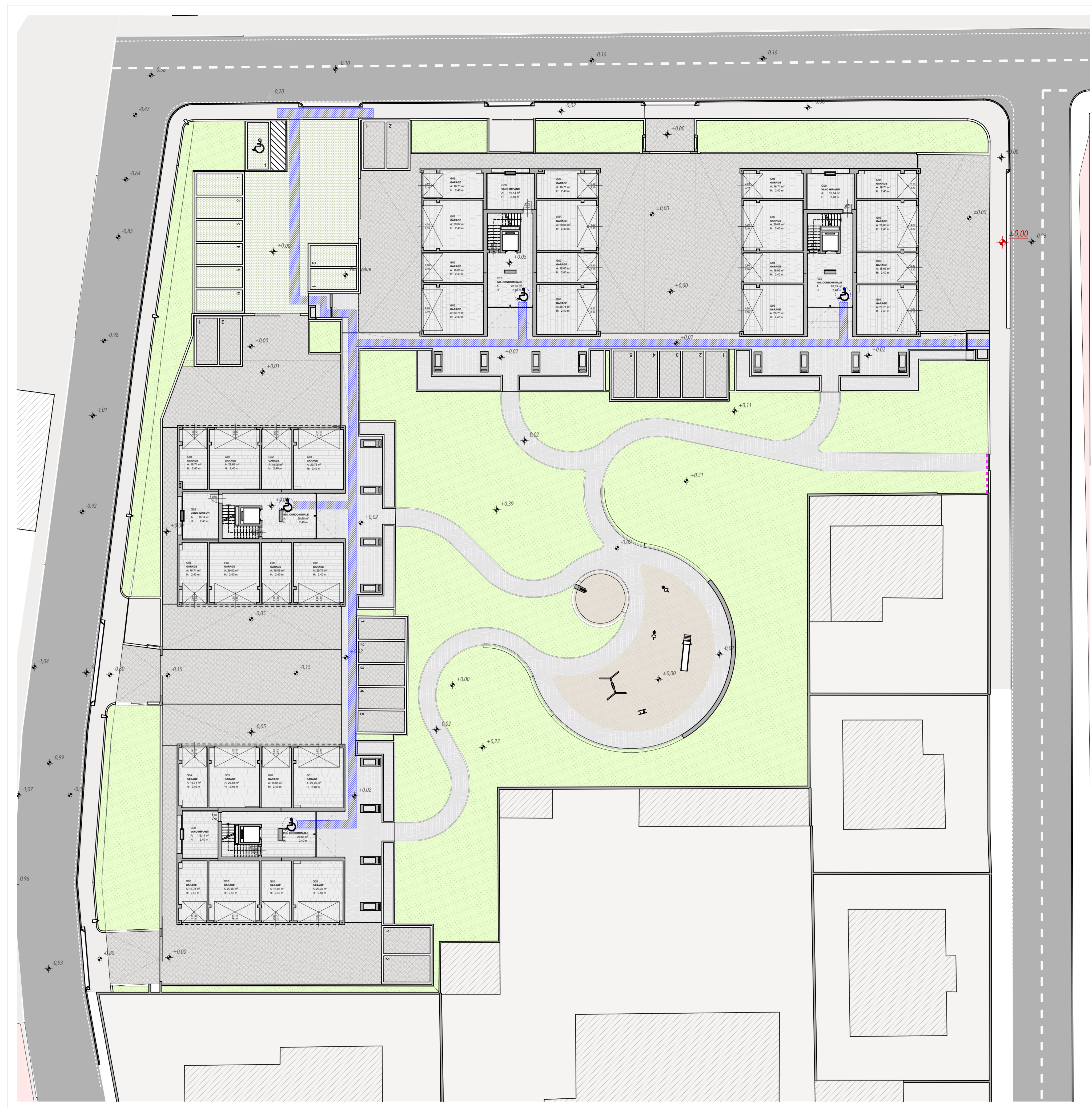
SUPERAMENTO DELLE BARRIERE ARCHITETTONICHE_1:200