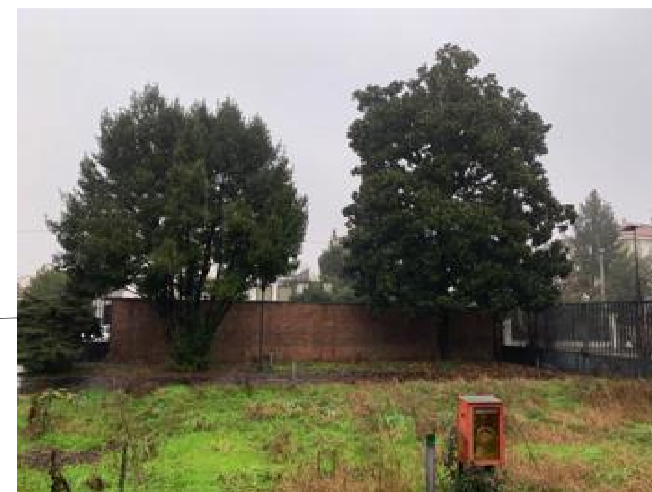
1 non identificato , 2 magnolia H > 10 ml Alberature preservate nel progetto