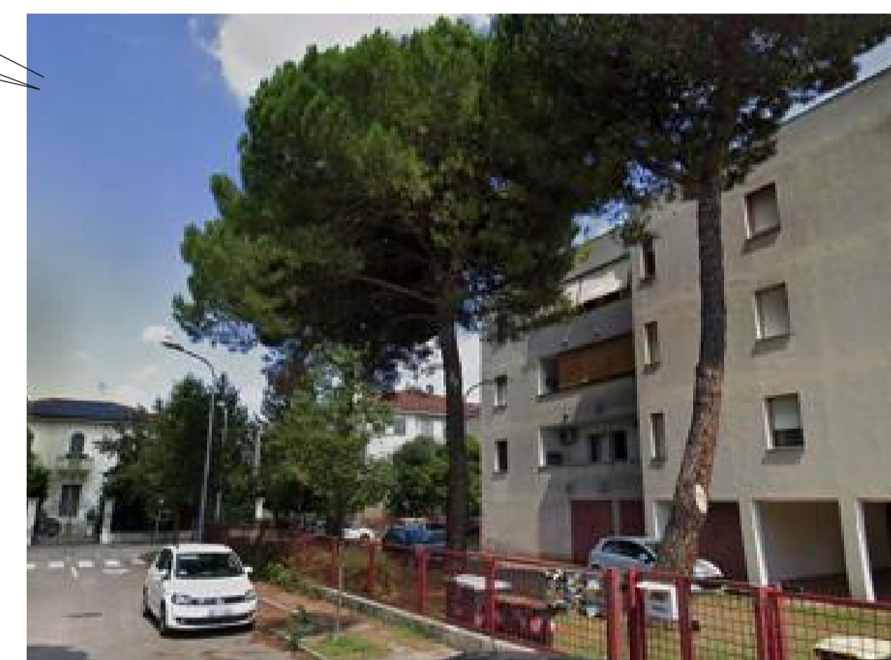
E1,E2,E3 pino marittimo – alberature esterne in altra proprietà privata