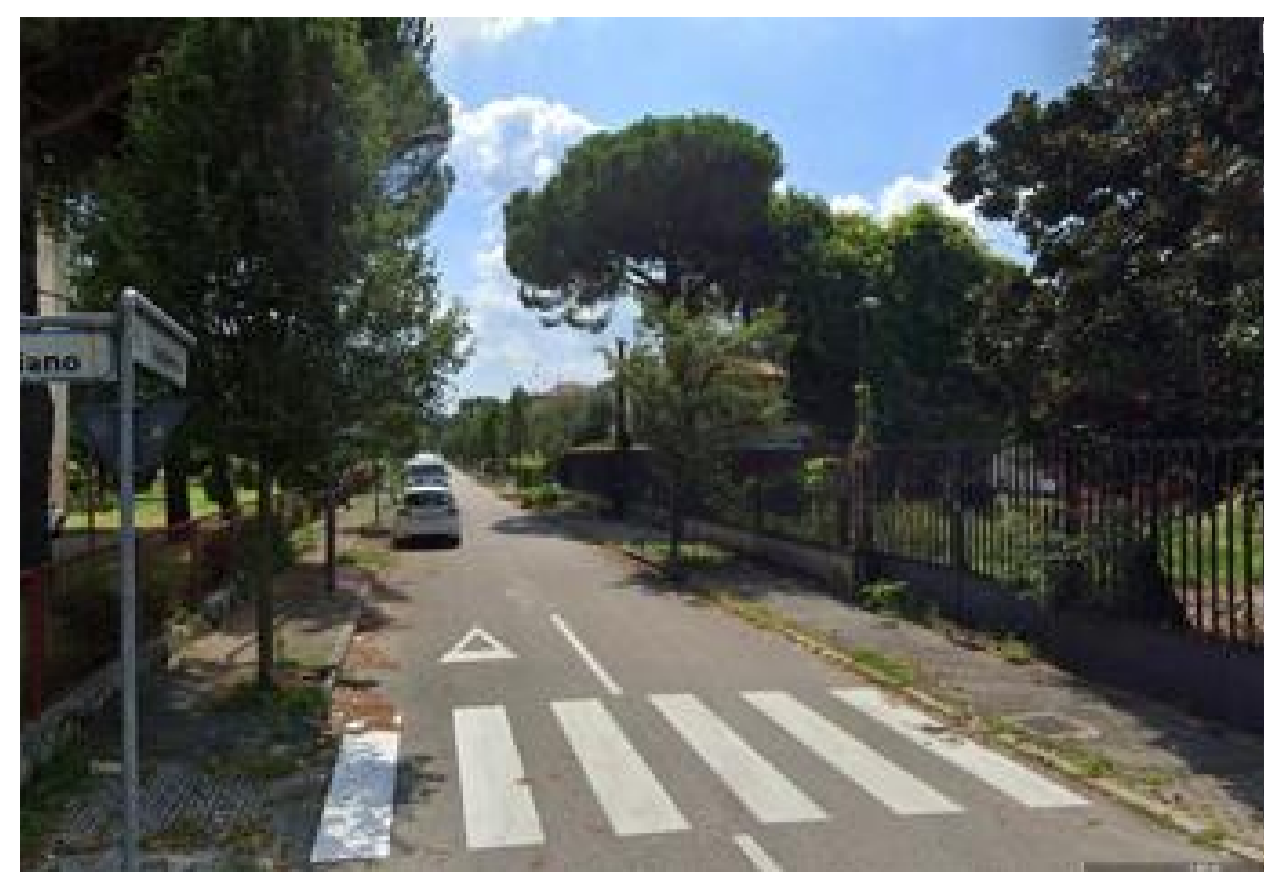
E10, E11 Biancospino grignonensis – Alberature esterne stradali