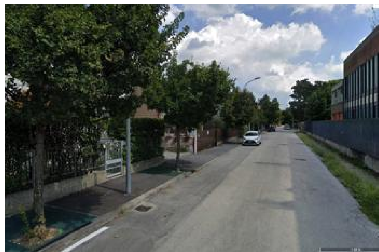
E4,E5,E6,E7,E8 Acer campestre – Alberature esterne stradali E9 Carpino – Alberature esterne stradali