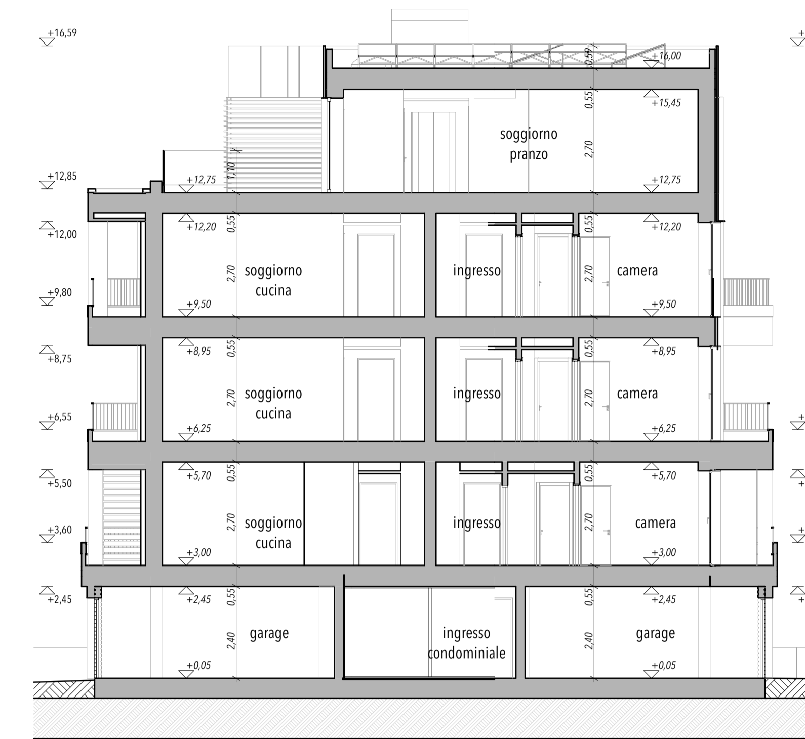
BLOCCO C - SEZIONE AA' - 1:100