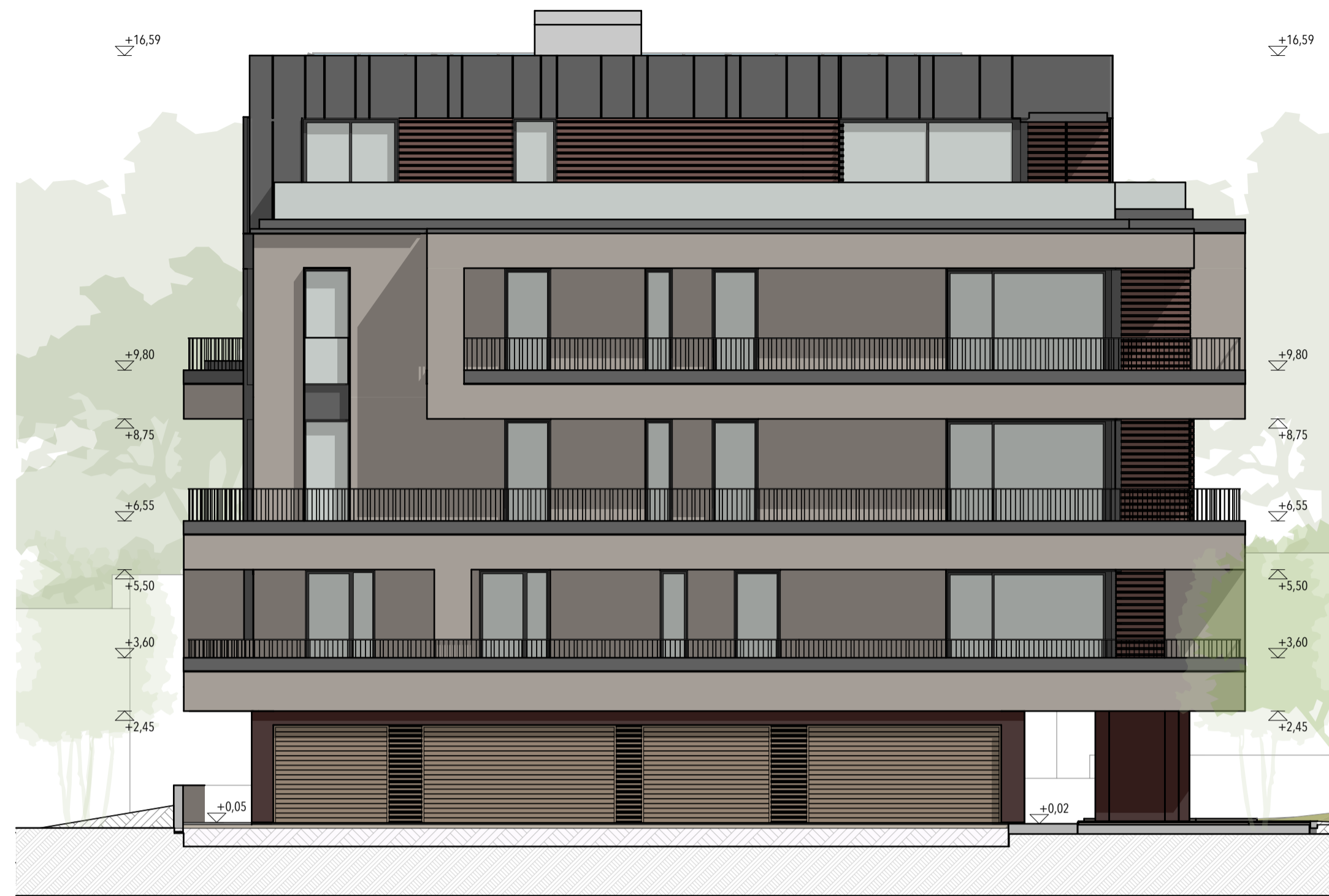
BLOCCO C - PROSPETTO SUD - 1:100