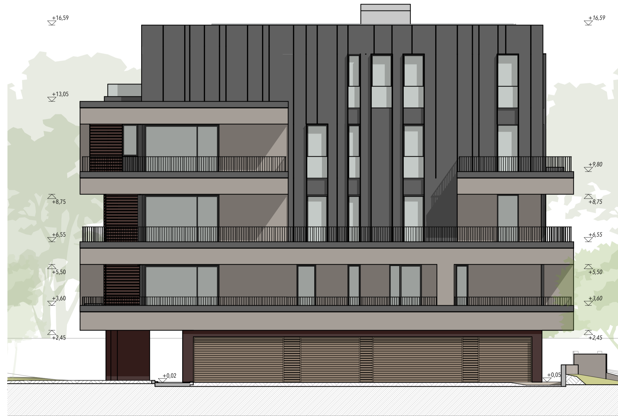
BLOCCO C - PROSPETTO NORD - 1:100