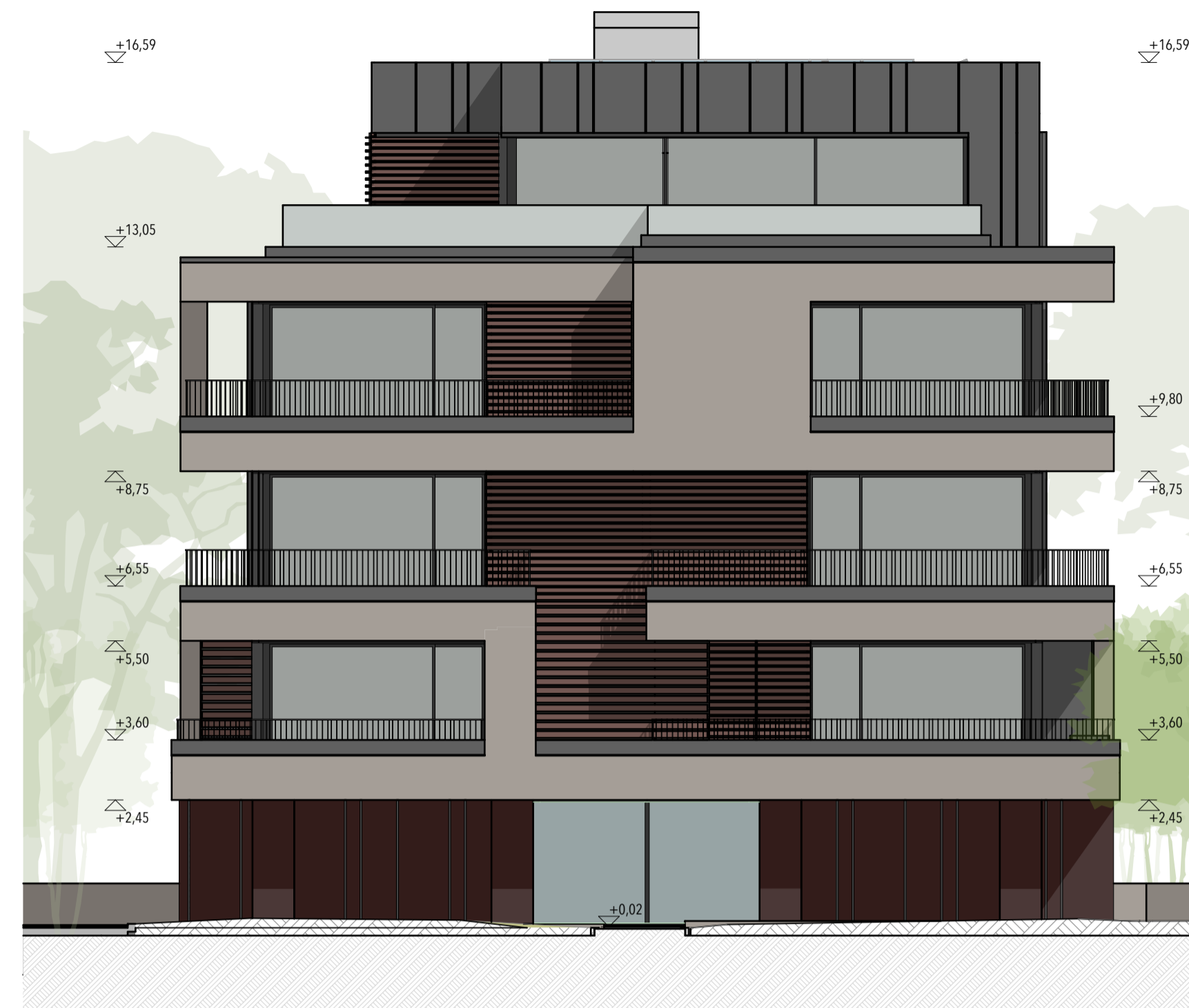
BLOCCO C - PROSPETTO EST - 1:100