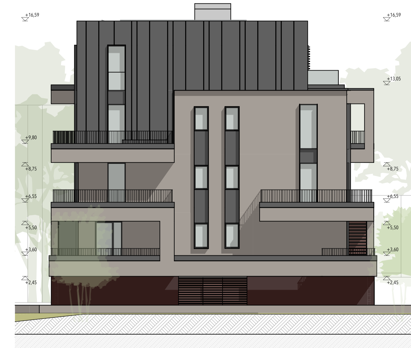
BLOCCO C - PROSPETTO OVEST - 1:100