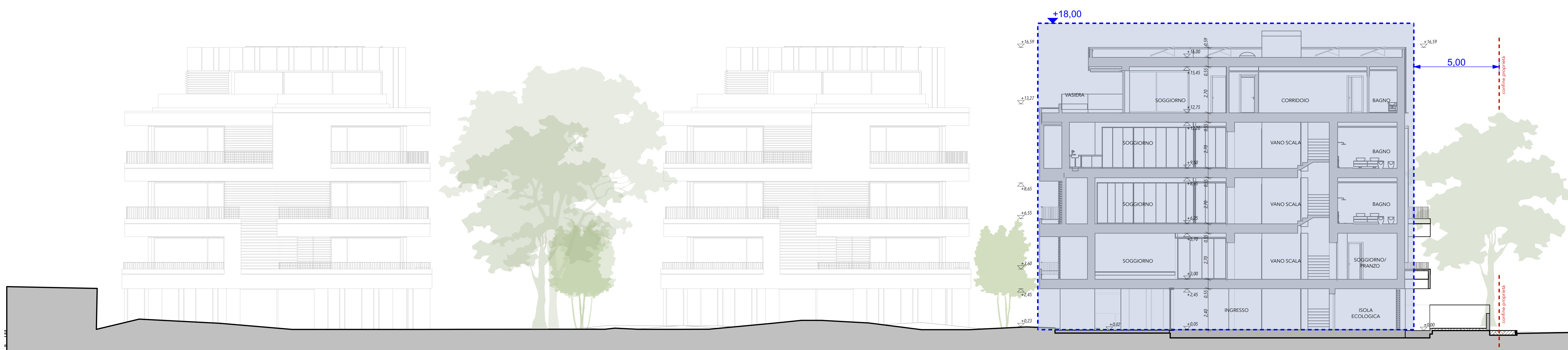
SEZIONE 2 (BLOCCO B) - 1:100