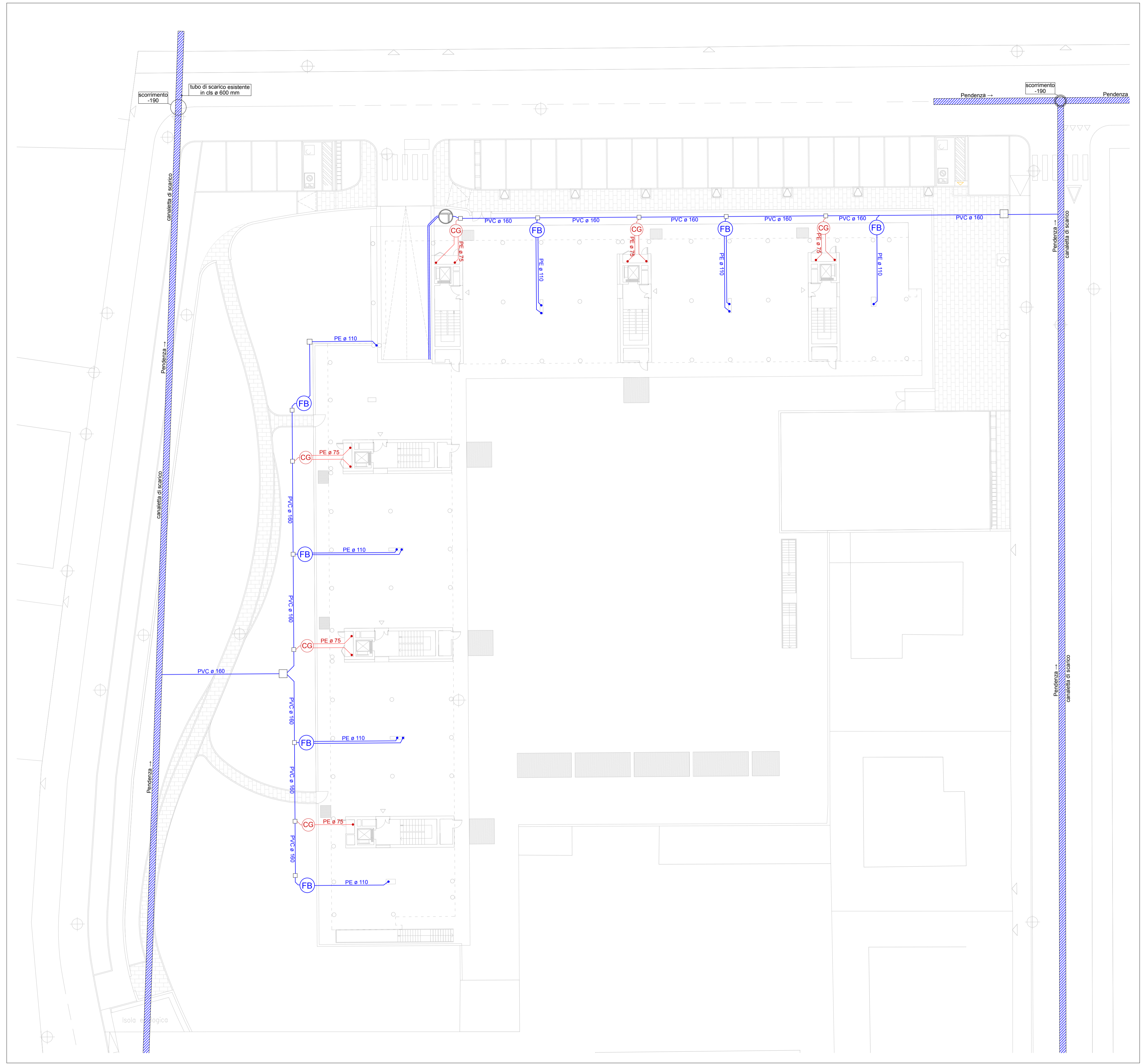
PUA AUTORIZZATO - OPERE DI URBANIZZAZIONE E SOTTOSERVIZI RETE ACQUE NERE 1:200