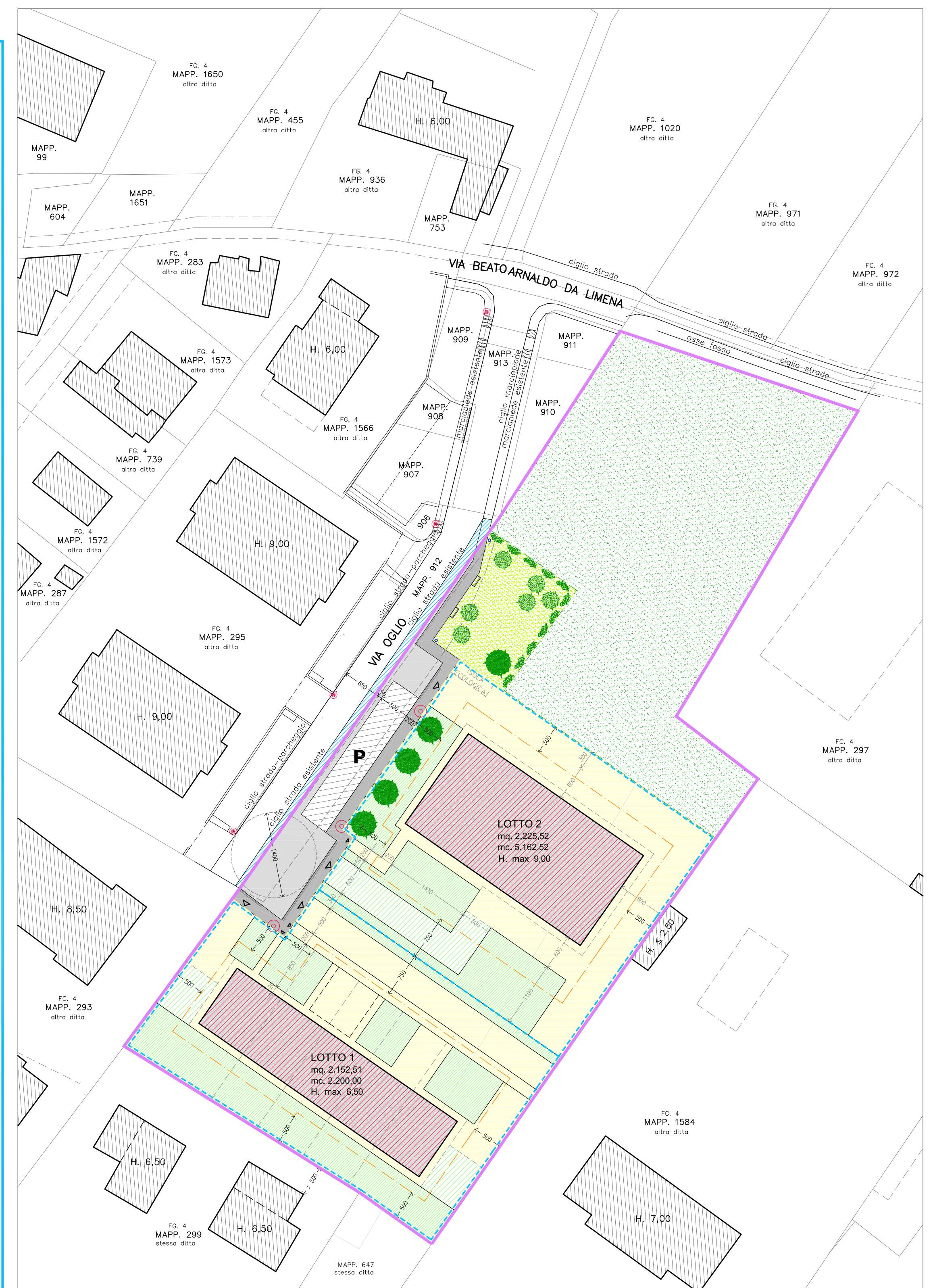
PLANIMETRIA DI PROGETTO SCALA 1:500