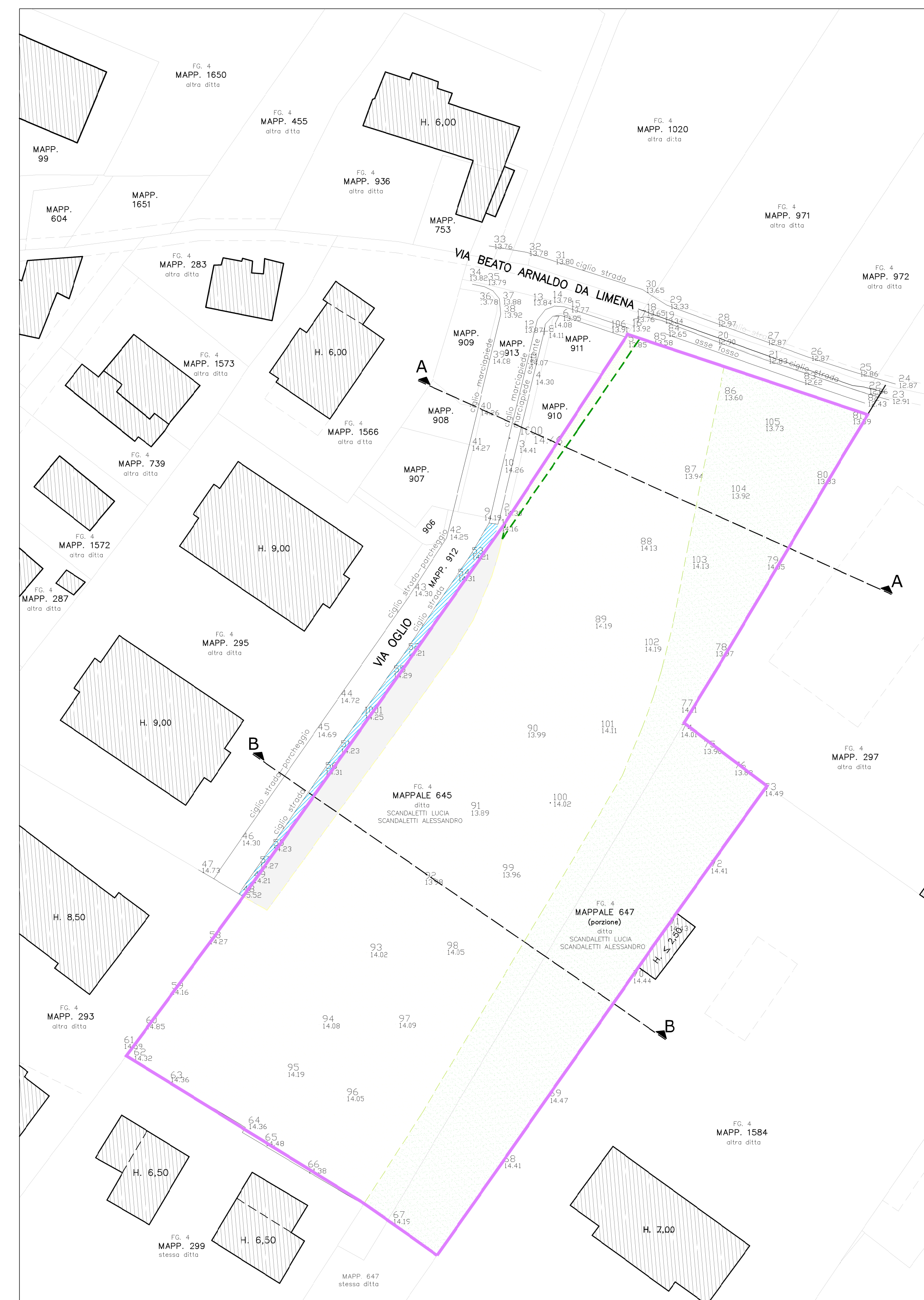
PLANIMETRIA - TRASPOSIZIONE DEL P.R.G. SU RILIEVO TOPOGRAFICO SCALA 1:500