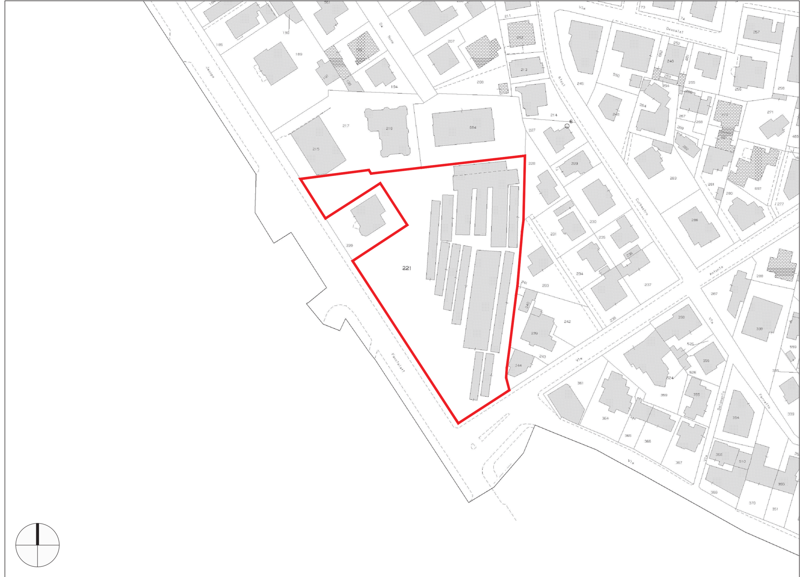
ESTRATTO N.C.T. FG. 141 MAPP. 221 SCALA 1:1000