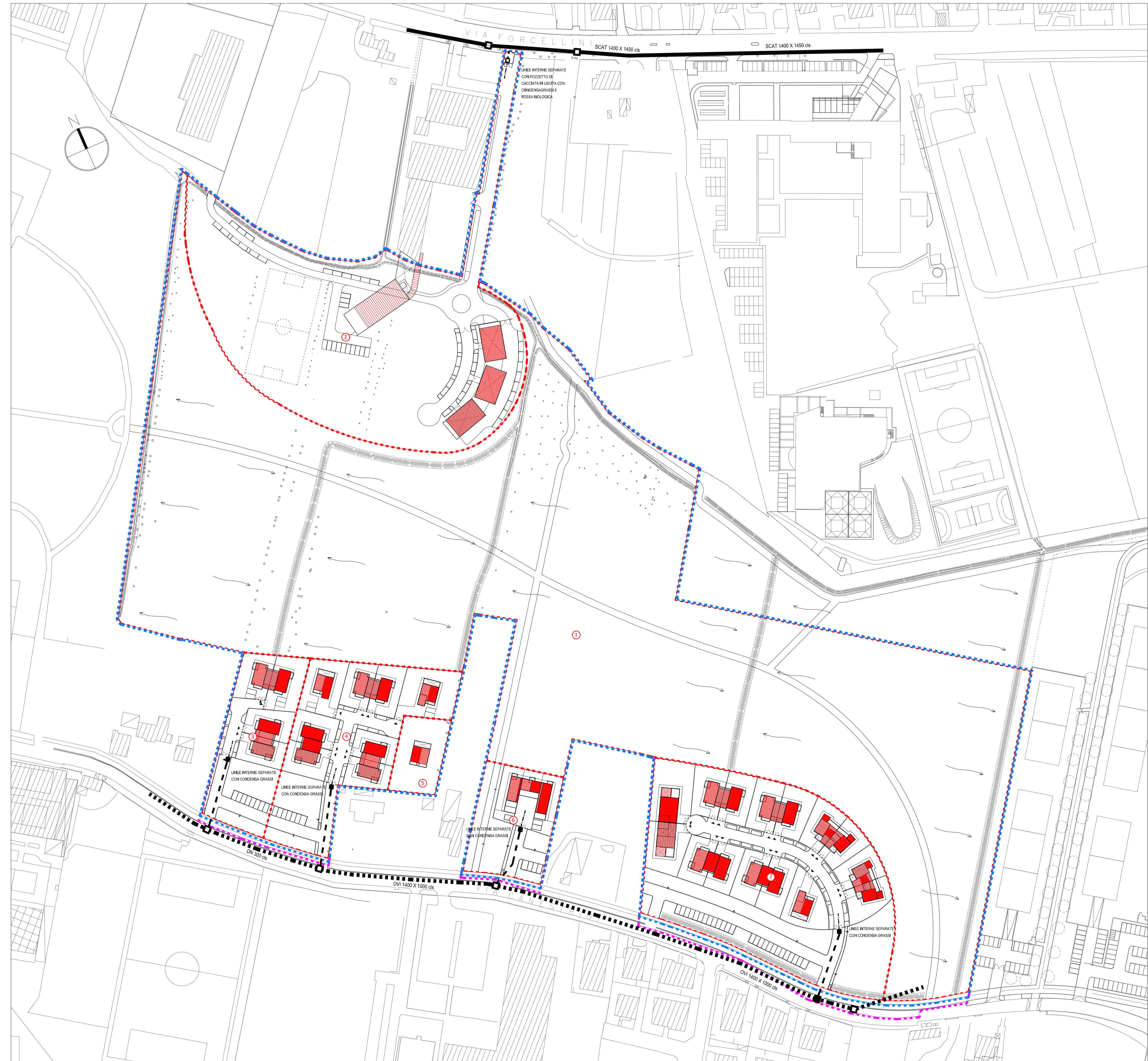
PLANIMETRIA SCHEMA RETE DISTRIBUZIONE IDRICA E GAS scala 1:1000