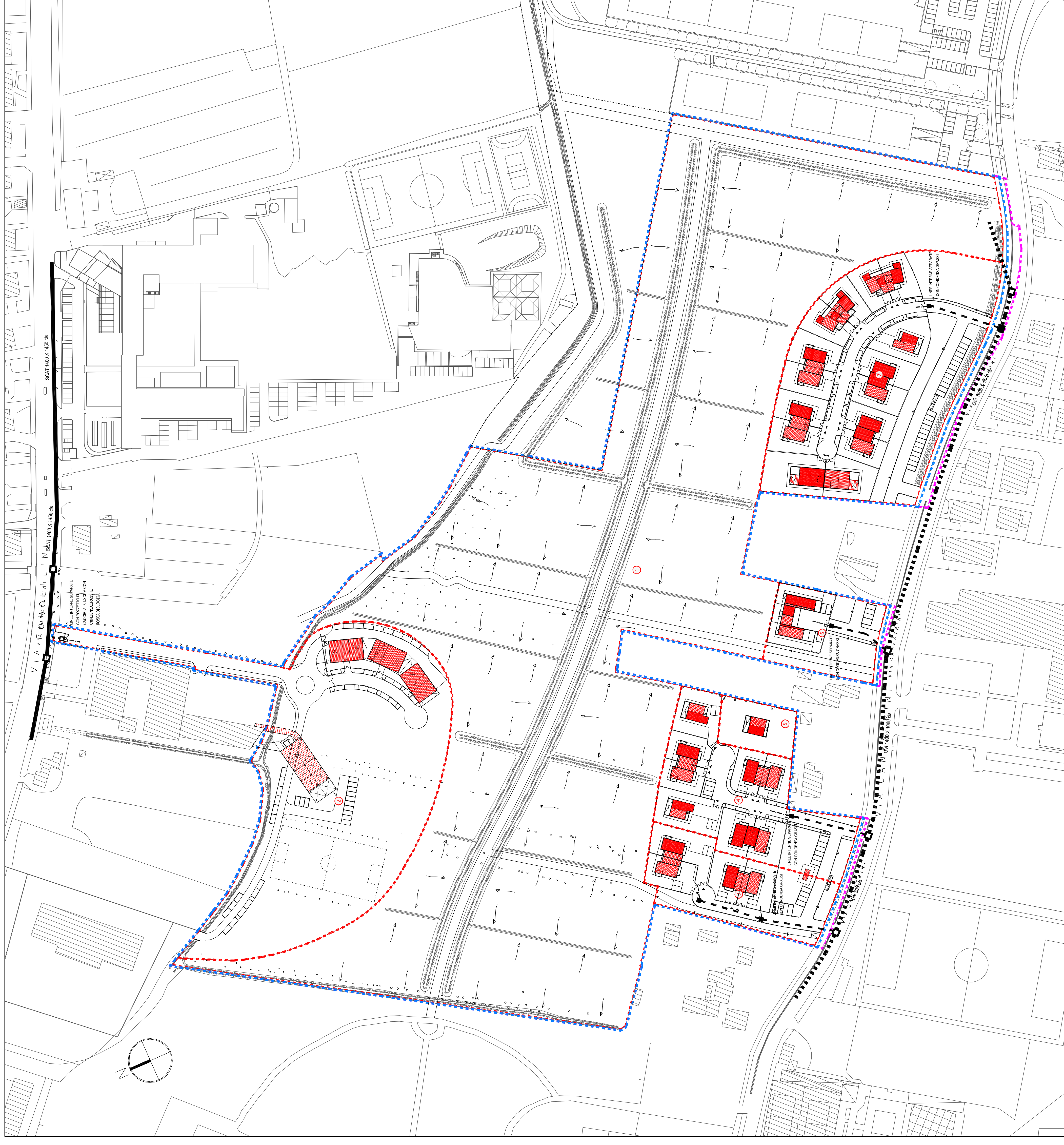
PLANIMETRIA SCHEMA RETE DISTRIBUZIONE IDRICA E GAS - scala 1:1000