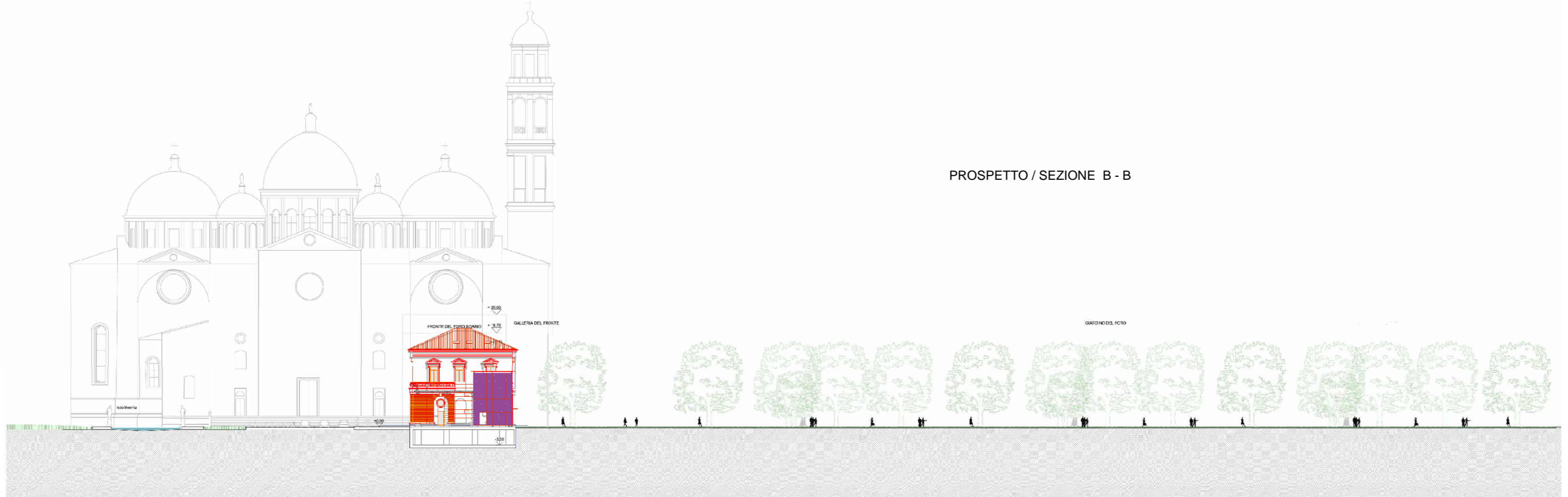
PROSPETTO / SEZIONE B - B