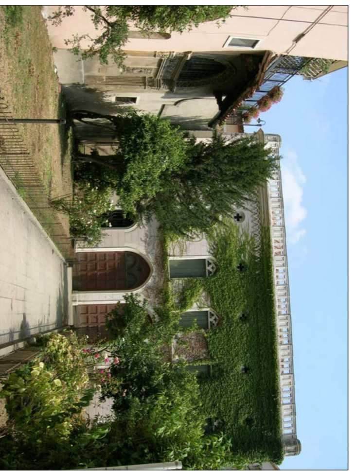
RESTAURO PORTALE LOMBARDESCO RESIDUALE "CHIESA"