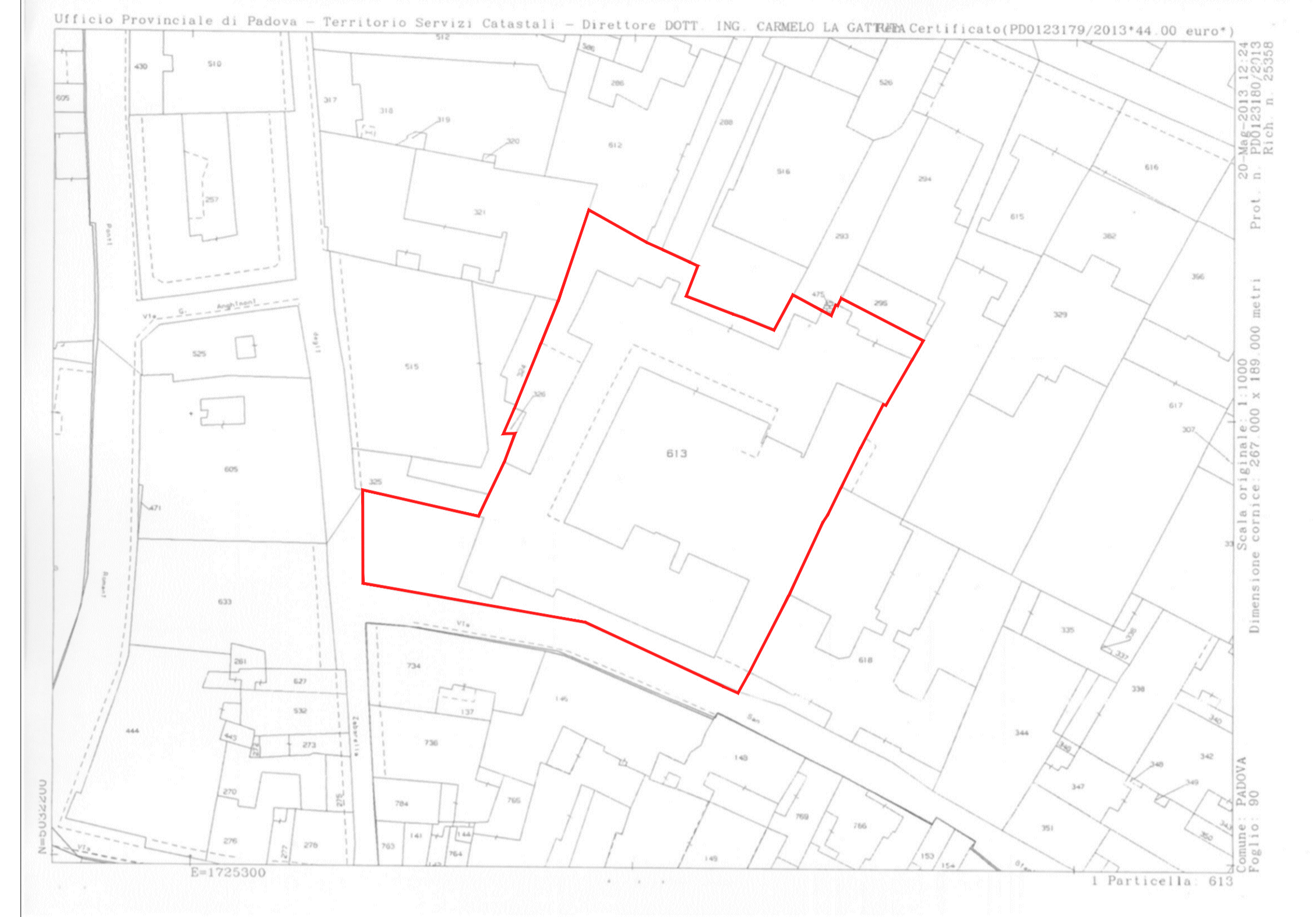
Estratto di Mappa sc. 1:1000 - Fg. 90 - map.li n. 326 e 613