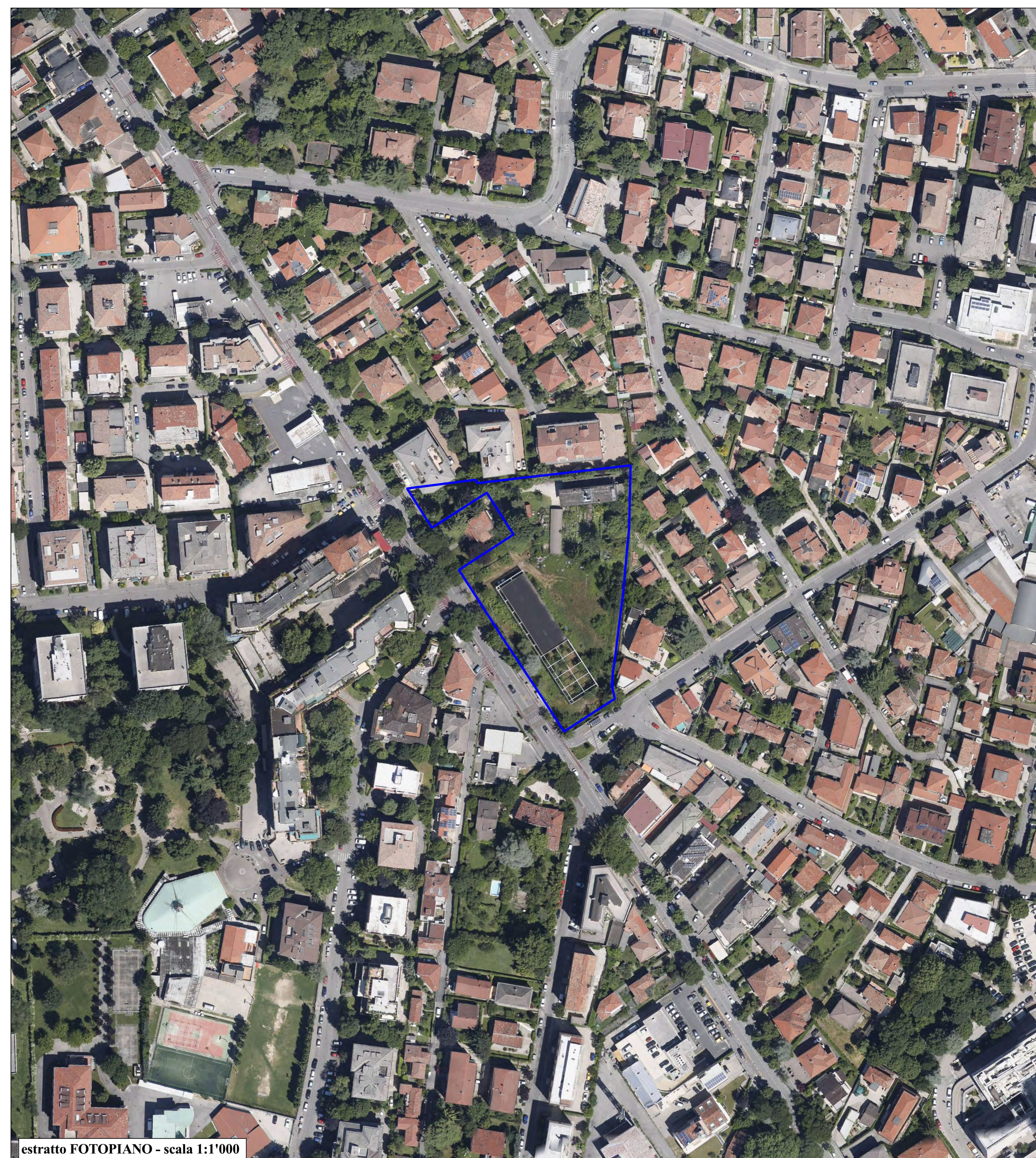
estratto FOTOPIANO - scala 1:1'000