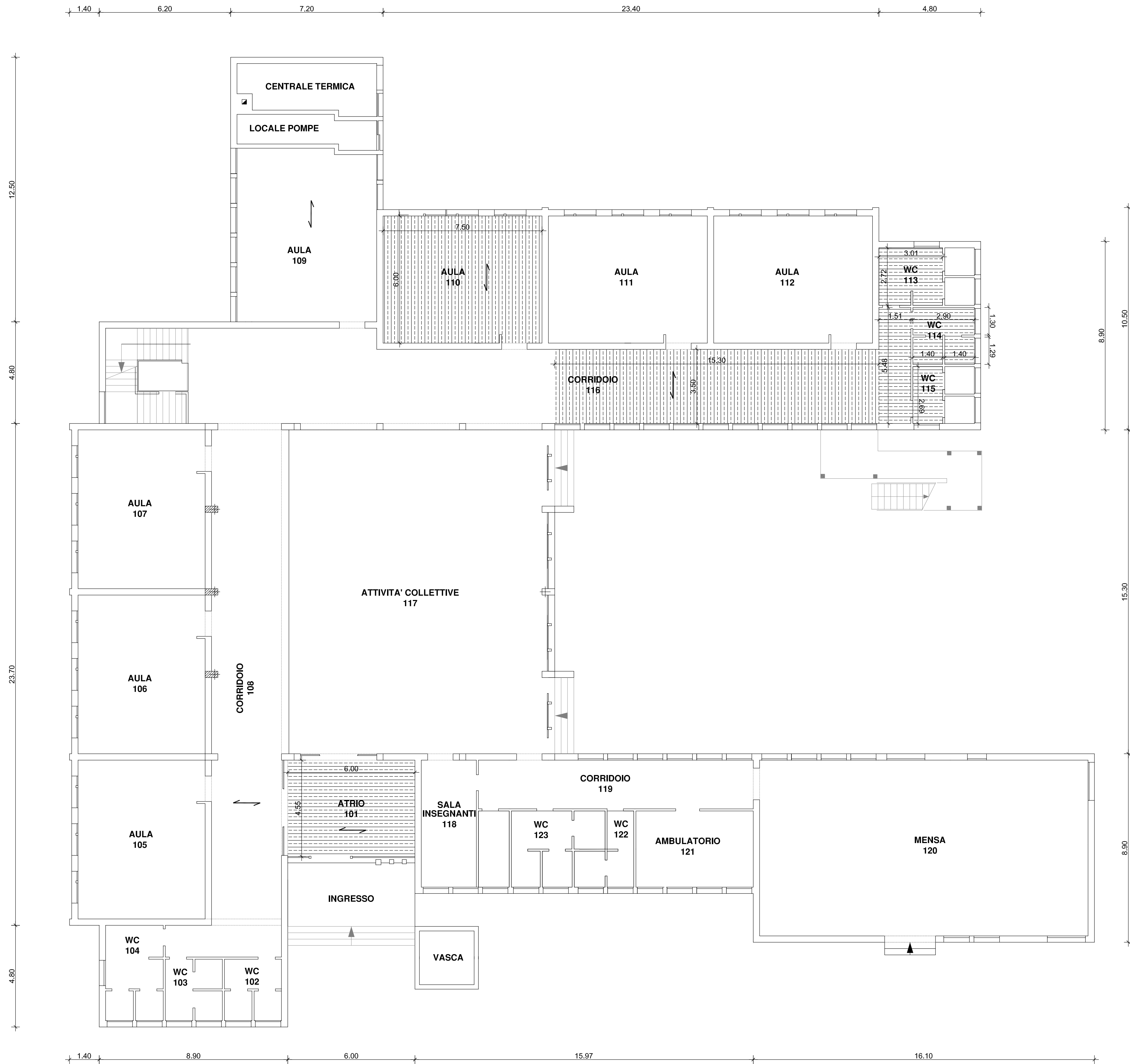
PLANIMETRIA PIANO TERRA Sc. 1:100