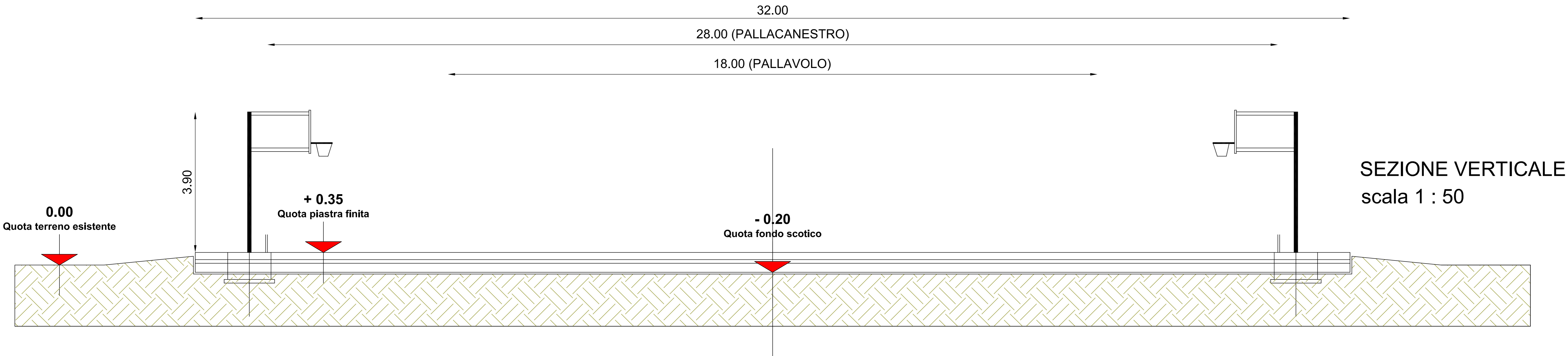
SEZIONE VERTICALE scala 1 : 50